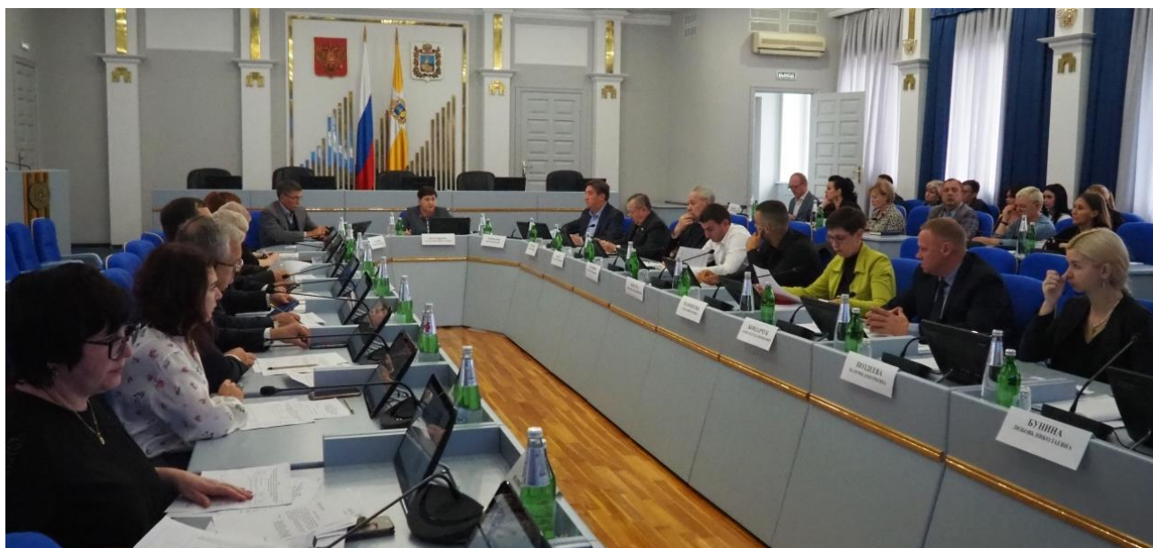
Совместное заседание комитетов по социальной политике и здравоохранению и по казачеству, безопасности, межпарламентским связям и общественным объединениям

Пособие объединило ряд действующих мер соцподдержки: ежемесячное пособие женщине, вставшей на учет в медицинской организации в ранние сроки беременности; пособие по уходу за ребенком; ежемесячную выплату в связи с рождением (усыновлением) первого и второго ребенка; ежемесячную денежную выплату на ребенка от 3 до 7 лет; ежемесячную денежную выплату на ребенка от 8 до 17 лет.