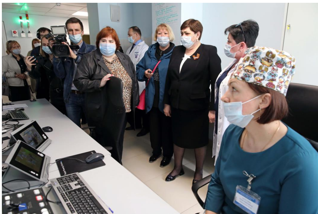
Выездное заседание Комитета в ГБУЗ СК "Ставропольский краевой клинический онкологический диспансер"

О поддержке обращения Законодательного Собрания Республики Карелия к Заместителю Председателя Правительства Российской Федерации Голиковой Т.А. и Министру строительства и жилищно-коммунального хозяйства Российской Федерации Файзуллину И.Э.;