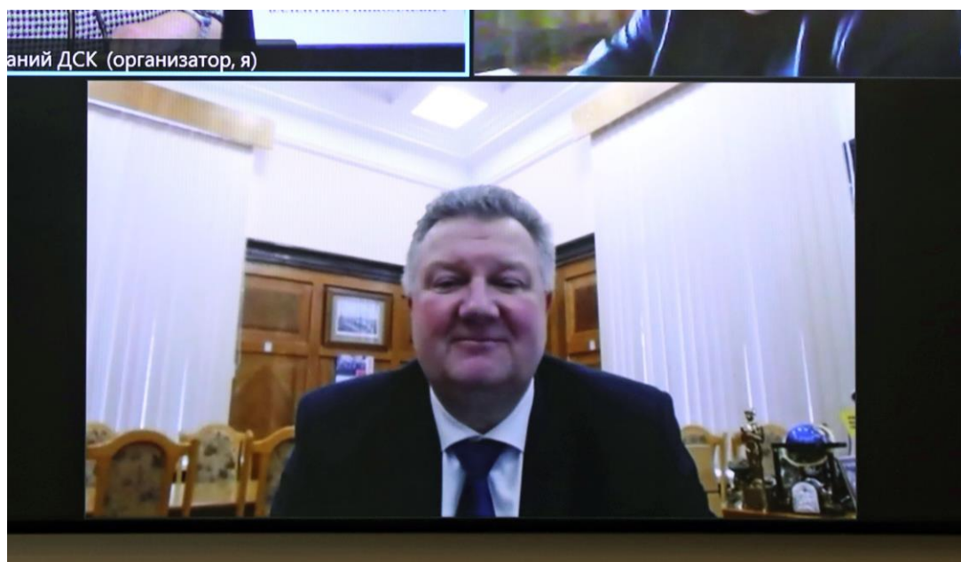
Заместитель председателя Комитета Мурашко Н.А. на заседании Комитета в режиме ВКС

В связи с изменениями, внесёнными в Закон о занятости, которыми установлены условия выполнения работодателями квоты, а также случаи, когда квота считается выполненной, статья 6 Закона о квотировании приведена в соответствие с внесенными изменениями.