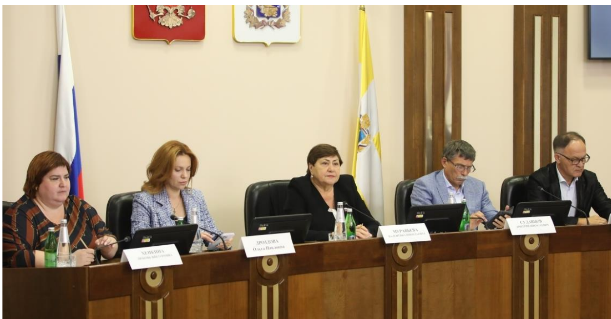
Заседание Комитета Думы Ставропольского края по социальной политике и здравоохранению

В январе – декабре 2022 года комитет Думы Ставропольского края по социальной политике и здравоохранению (далее – Комитет) осуществлял свою деятельность в соответствии с Положением о комитете Думы Ставропольского края по социальной политике и здравоохранению, утвержденным постановлением Думы Ставропольского края от 30 сентября 2021 года № 11-VII ДСК, годовыми и месячными планами работы комитета.