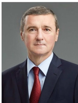
Кузьмин А.С. заместитель председателя Думы