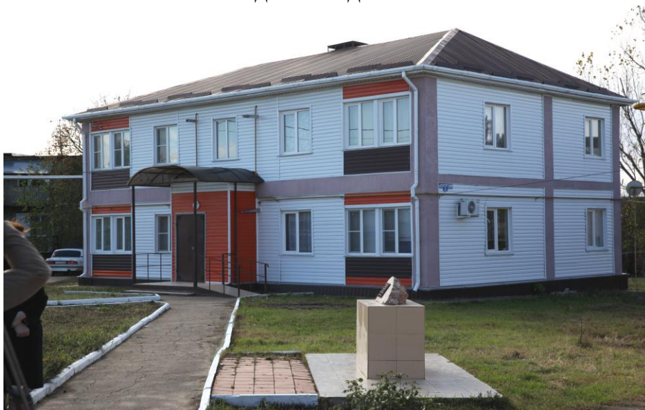
Жилой дом для детей сирот в Новоалександровском городском округе

С 2011 года в Новоалександровске построены 4 жилых объекта, большую часть квартир в которых получили дети-сироты. Депутаты посетили два заселенных дома и пока незавершенный 24-квартирный, где уже в 2018 году получат жилье бывшие воспитанники детских домов.