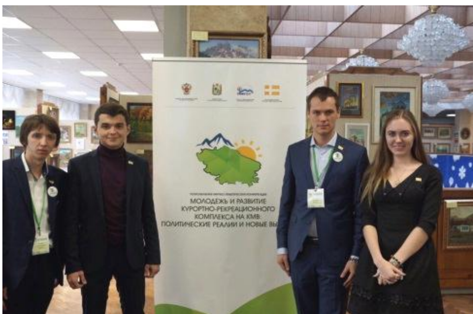
Региональная научно-практическая конференция "Молодежь и развитие курортно-рекреационного комплекса на КМВ, политические реалии и новые вызовы"

По предложению членов Молодежного парламента в городе-курорте Железноводске состоялась конференция: "Молодежь и развитие курортно-рекреационного комплекса на КМВ, политические реалии и новые вызовы". В ней приняли участие более 300 студенты филиала Северо-Кавказского федерального университета и Ставропольского государственного педагогического института. По итогам издан сборник статей.