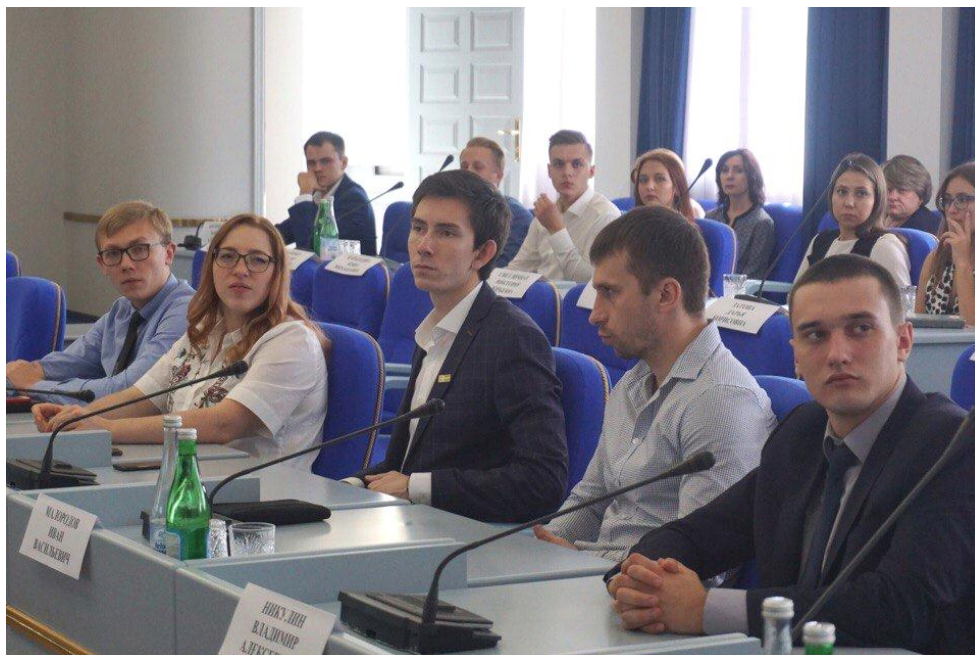
Члены Молодежного парламента на заседании круглого стола

ного парламентского движения, выработки общих подходов к формированию и деятельности молодёжных парламентов.