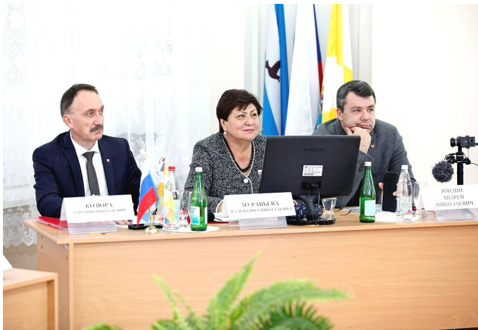
Депутаты В.Н. Муравьева, А.Н. Юндин, министр образования и молодежной политики Ставропольского края Е.Н. Козюра на совещании в Грачевском муниципальном районе

На совещании отмечалось, что в крае функционирует 629 образовательных организаций, где обучается 279011 чел. Из них все виды питания предоставляются 268168 детям, что составляет 96% от общего количества обучающихся. Горячее питание получают 93,7% школьников, в 2016 году данный показатель составил 92,4 процента в Российской Федерации 88,7 %.