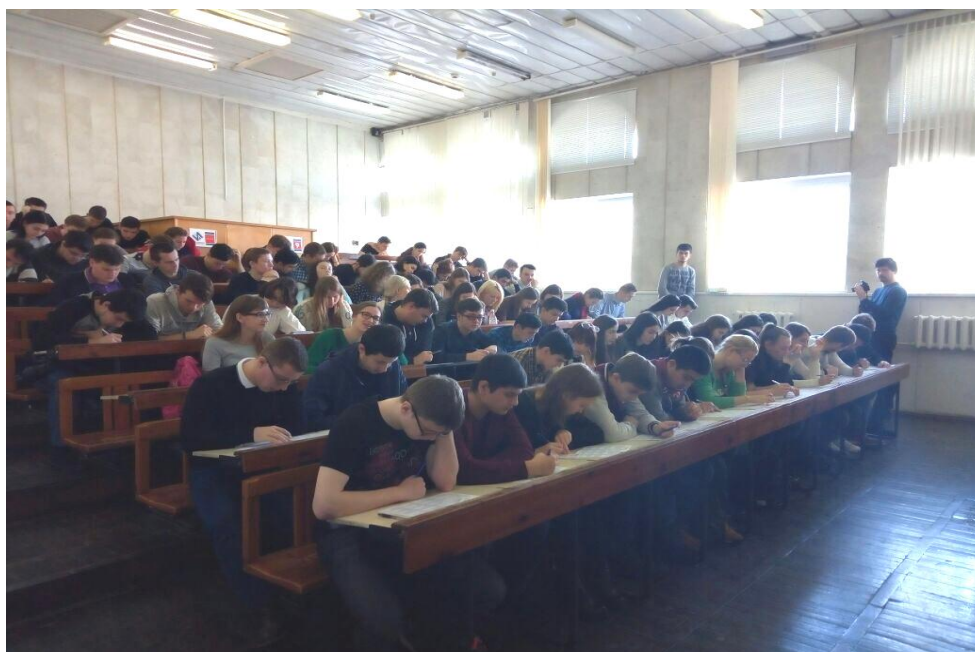
Тест по истории Отечества в Северо-Кавказском федеральном университете

проведение в крае Всероссийского теста по истории Отечества. Было организовано 829 площадок для сдачи теста с участием 8073 человек;