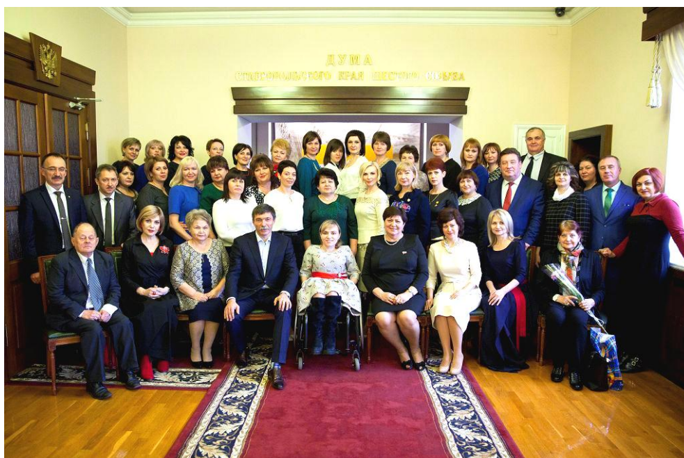
Участники торжественного приема

20 декабря 2017 года, второй год подряд накануне новогодних праздников в Думе Ставропольского края, по инициативе комитета по социальной и молодежной политике, образованию, науке, культуре и средствам массовой информации, прошел торжественный прием лучших представителей организаций социальной сферы края.