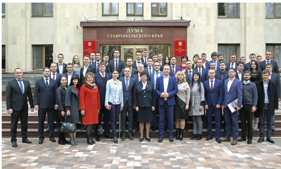
Общее собрание Совета молодых депутатов Ставропольского края

В рамках нормотворческой деятельности Советом молодых депутатов в городе-курорте Кисловодске было проведено заседание круглого стола на тему: "Совершенствование федерального и регионального законодательства, как основной аспект борьбы с безрецептурной продажей лекарственных препаратов".