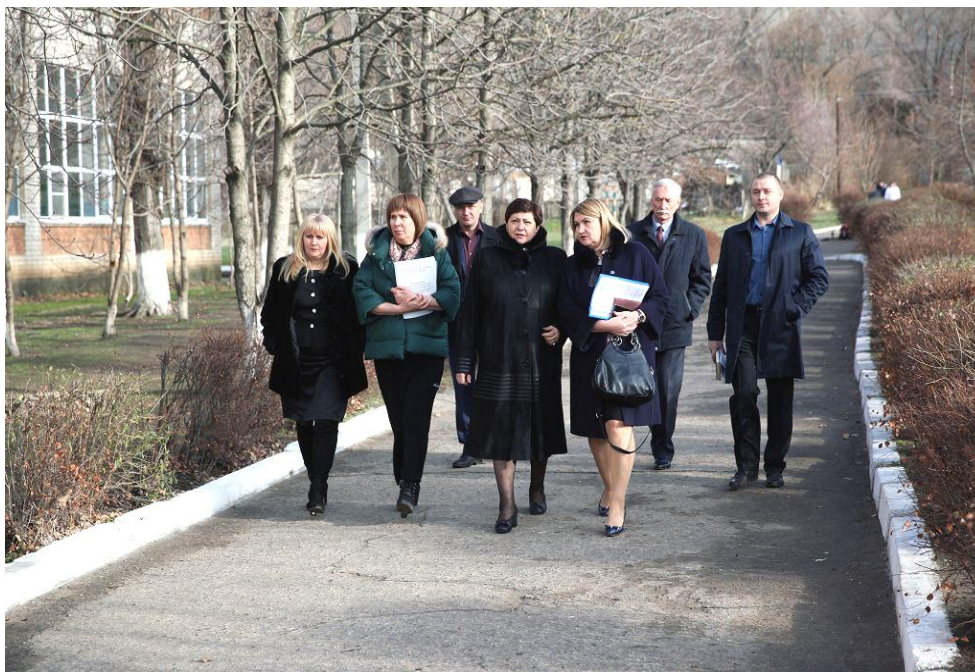
Депутат В.Н. Муравьева и участники совещания в селе Бешпагир Грачевского муниципального района

11 декабря 2017 года на территории Грачевского муниципального района состоялось совещание на тему: "Об исполнении Закона Ставропольского края "Об образовании" в части организации питания обучающихся в образовательных организациях края"