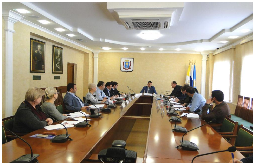
Заседание "круглого стола" в городе-курорте Кисловодске

В рамках нормотворческой деятельности Советом молодых депутатов в городе-курорте Кисловодске было проведено заседание круглого стола на тему: "Совершенствование федерального и регионального законодательства, как основной аспект борьбы с безрецептурной продажей лекарственных препаратов".