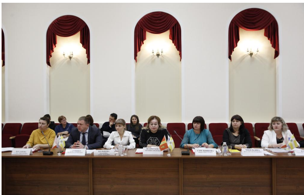
Участники совещания в Новоалександровском городском округе

По итогам обсуждения приняты рекомендации, которые утверждены на заседании комитета. Они касаются: