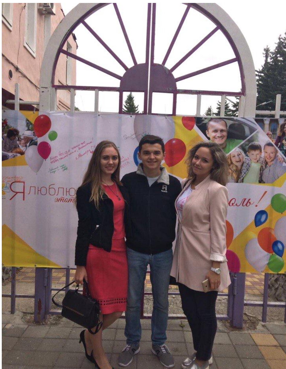
Члены Молодежного парламента на общегородской акции "Я люблю этот город!"

С целью изучения мнения молодежи членами Молодежного парламента проведено анкетирование по проблемам реализации молодежной политики, внедрения Всероссийского физкультурно-оздоровительного комплекса "Готов к труду и обороне", исполнения Закона Ставропольского края "Об ограничении продажи электронных систем доставки никотина".