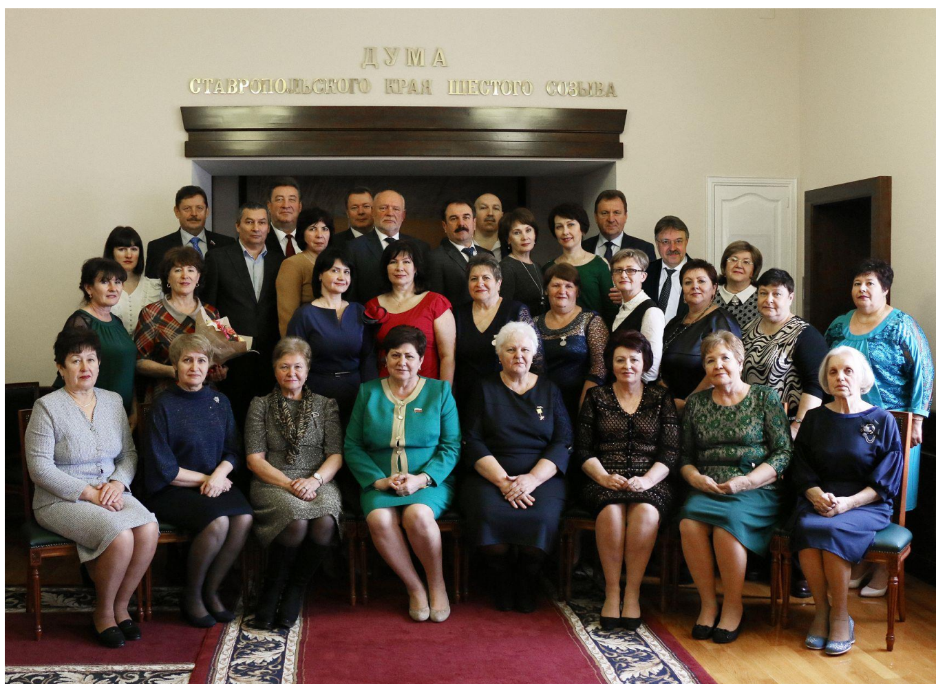
Участники торжественного приема лучших представителей организаций социальной сферы в Думе Ставропольского края

Все участники получили памятные подарки.