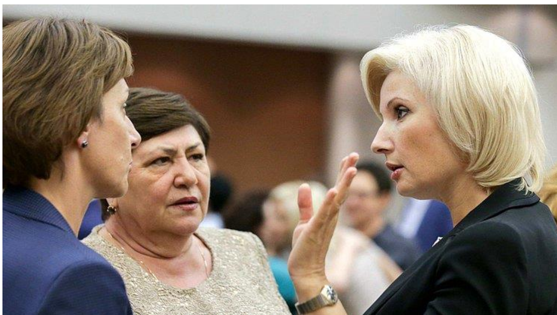
В.Н. Муравьева на парламентско-общественных слушаниях в Государственной Думе Российской Федерации

В слушаниях участвовали депутаты Государственной Думы, представители законодательной и исполнительной власти субъектов Российской Федерации, институтов гражданского общества, эксперты, представители Правительства Российской Федерации.