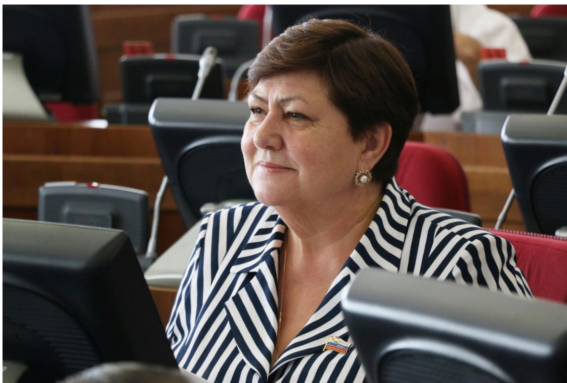
Председатель Комитета В.Н. Муравьева на заседании Думы Ставропольского края

Разница между суммой материального обеспечения пенсионера и установленной величиной прожиточного минимума составляет размер социальной доплаты к пенсии.