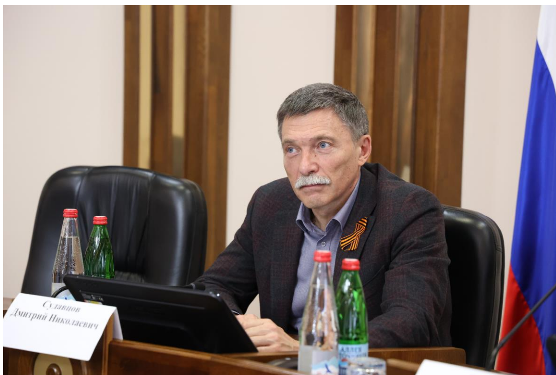
Д.Н. Судавцов, первый заместитель председателя Думы Ставропольского края