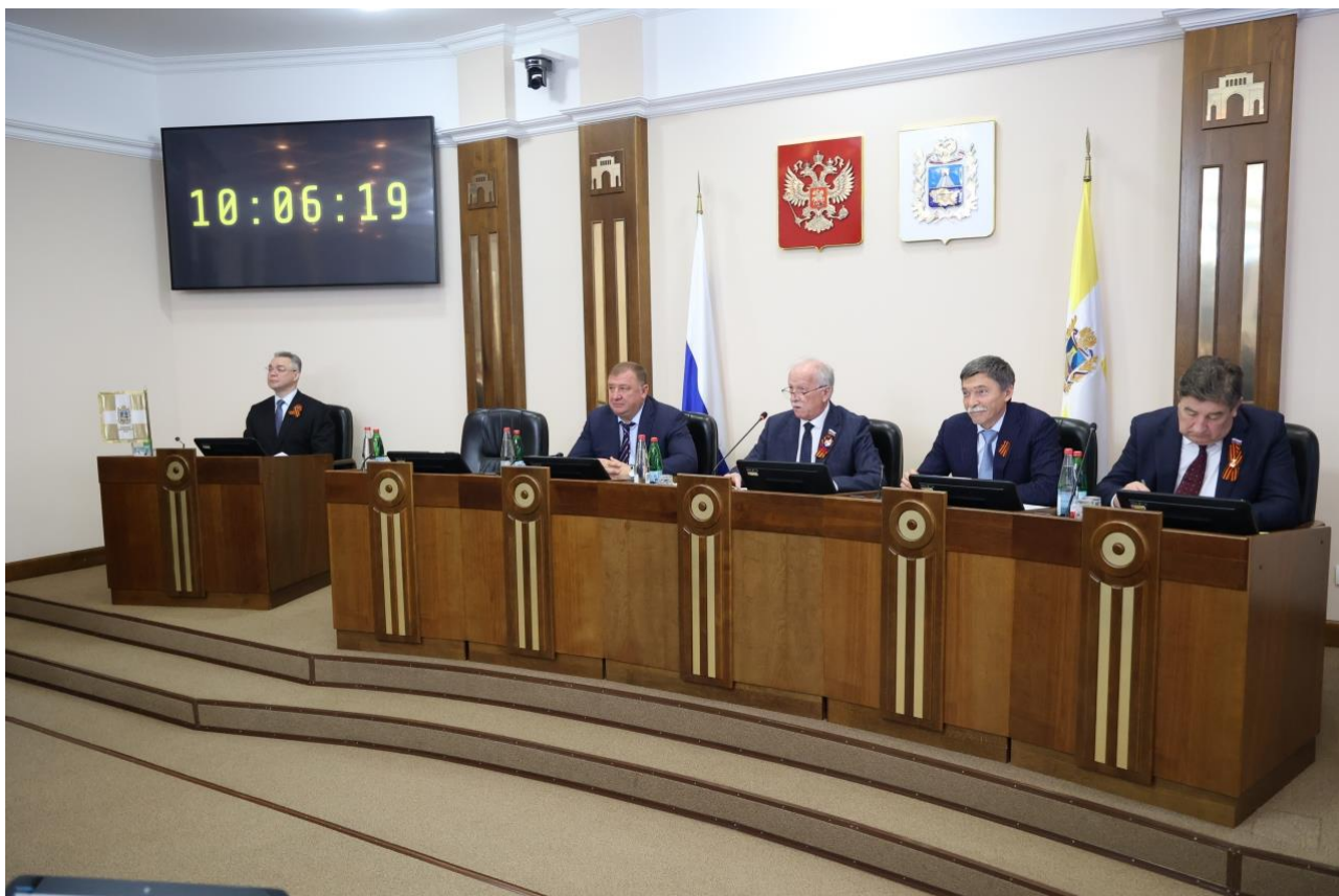
Заседание Думы Ставропольского края

Закон Ставропольского края от 02 апреля 2025 г. № 25-кз "О внесении изменений в статьи 3 и 5 Закона Ставропольского края "Об Уполномоченном по защите прав предпринимателей в Ставропольском крае" (законопроект № 498-7)