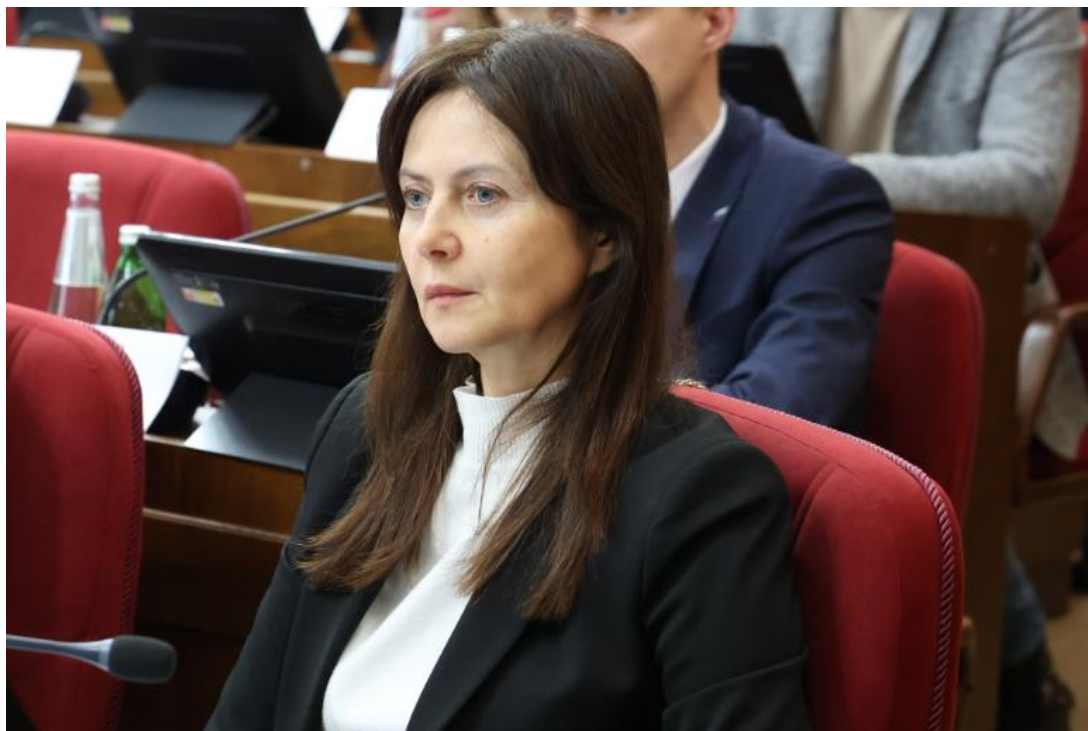
Е.А. Афонина, руководитель управления Федеральной налоговой службы по Ставропольскому краю

от 28 апреля 2025 года № 1482 VIII-ДСК "О поддержке обращения Законодательного Собрания Нижегородской области "К Председателю Государственной Думы Федерального Собрания Российской Федерации В.В. Володину о необходимости скорейшего принятия проекта федерального закона № 348960-8 "О внесении изменений в часть четвертую Гражданского кодекса Российской Федерации";