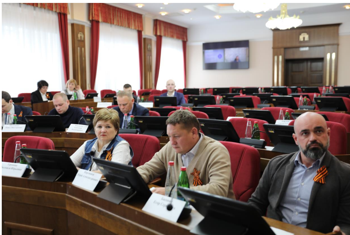
Совещание в комитете 10 апреля 2025 года