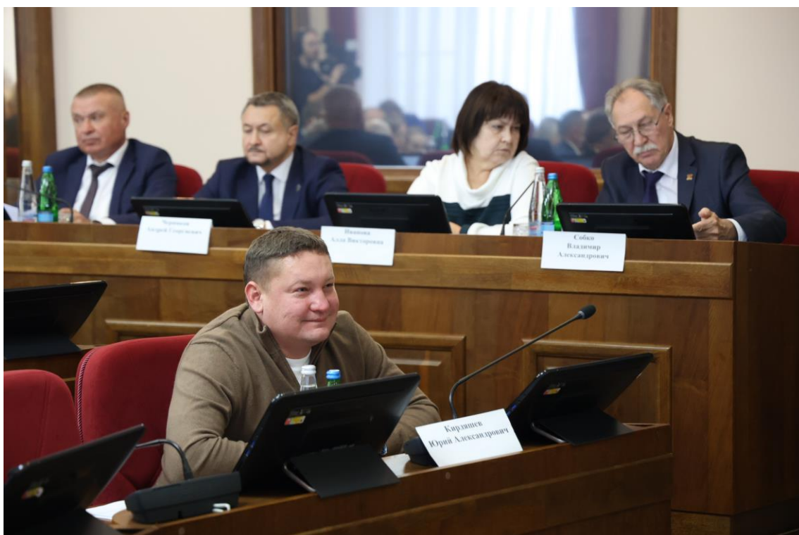
Совещание в комитете 4 декабря 2025 года