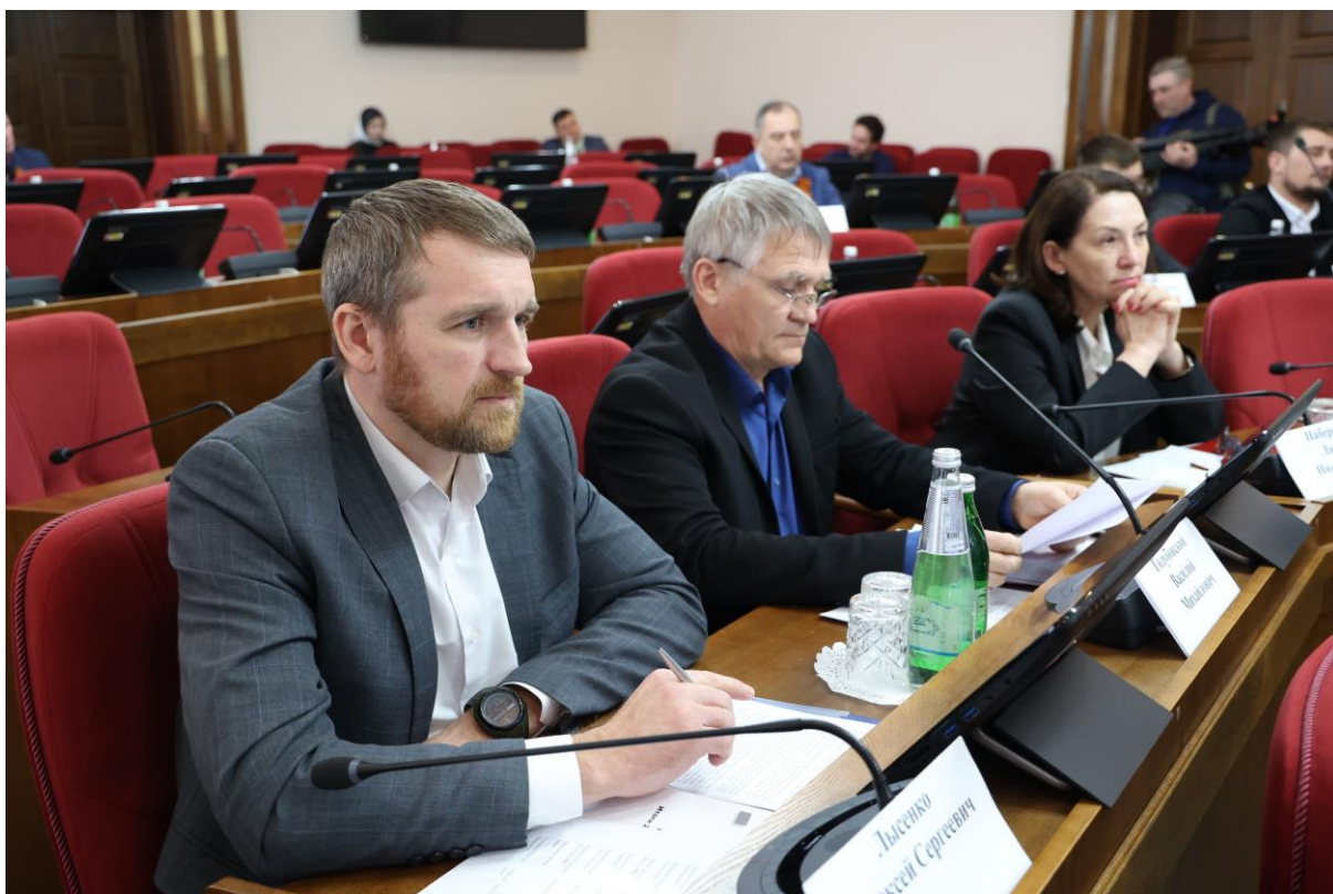
Совещание в комитете 18 февраля 2025 года