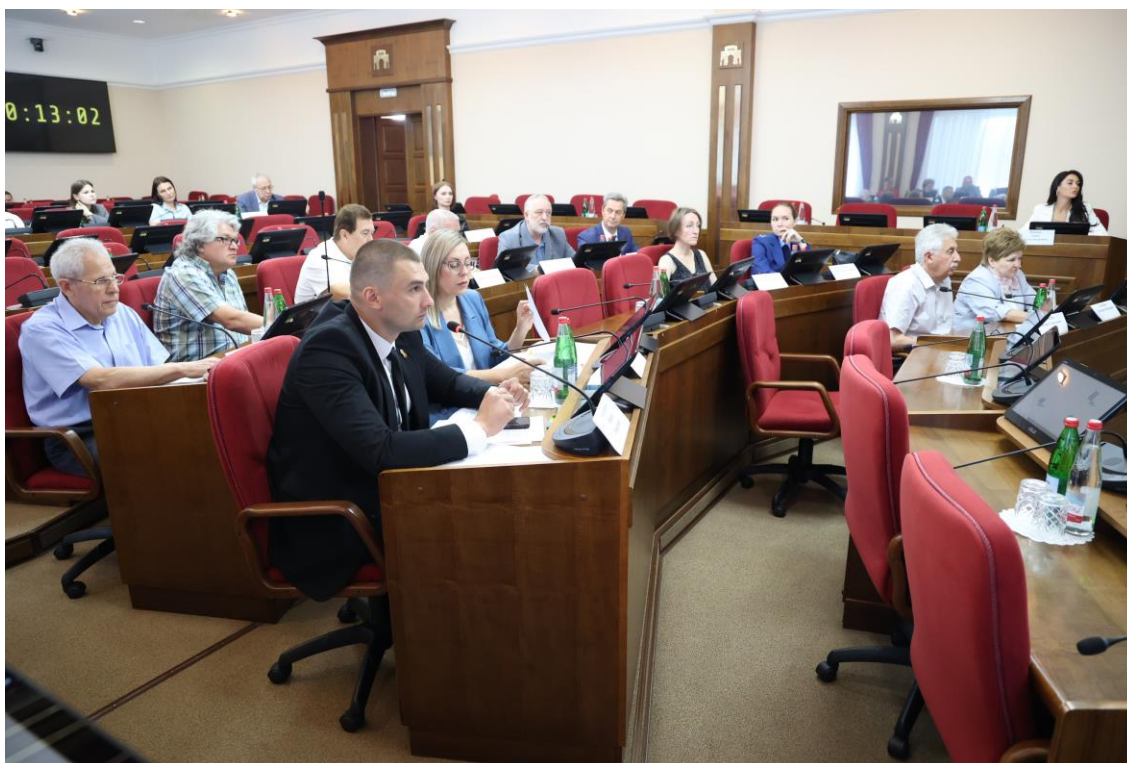
Совещание в комитете 3 июля 2025 года