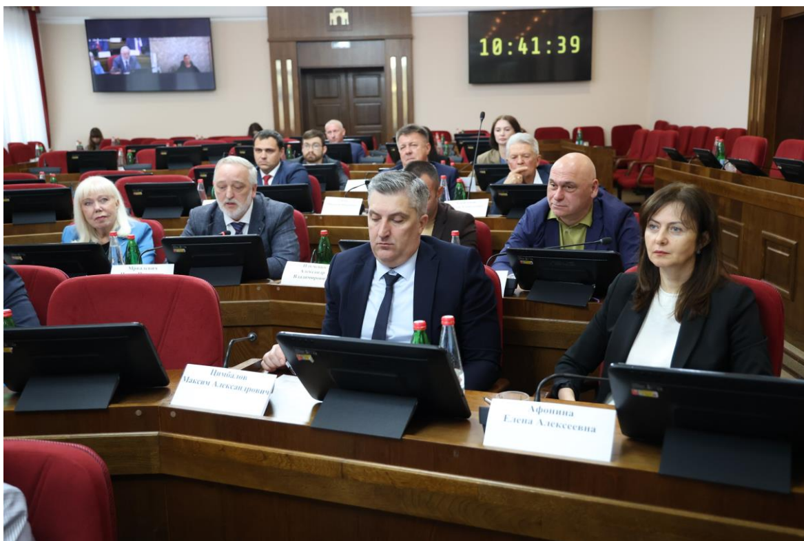
Совещание в комитете 20 мая 2025 года