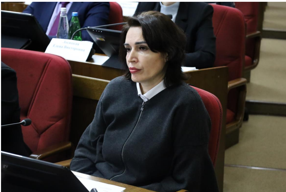
В.С. Тайдакова, министр физической культуры и спорта Ставропольского края

5) о поддержке обращений законодательных органов субъектов Российской Федерации – 2;