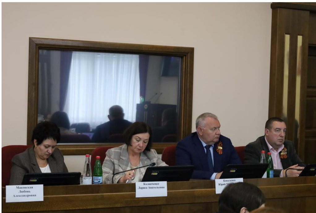
Заседание комитета 13 мая 2025 года

О плане работы комитета Думы Ставропольского края по экономическому развитию и собственности на июнь 2025 года.