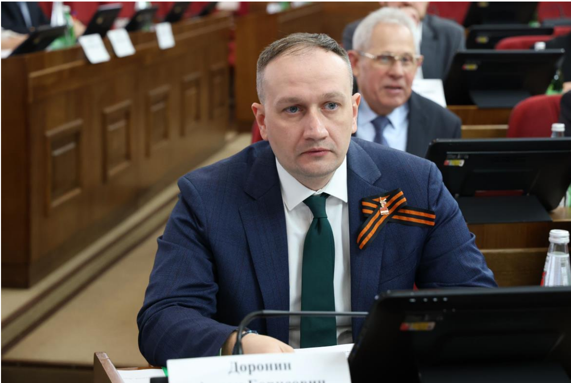
А.Б. Доронин, министр экономического развития Ставропольского края

4) об отзывах на проекты федеральных законов – 2: от 23 июня 2025 года 1534-VII ДСК "Об отзыве на проект федерального закона № 924770-8 "О внесении изменений в статьи 3.5 и 14.8 Кодекса Российской Федерации об административных правонарушениях";