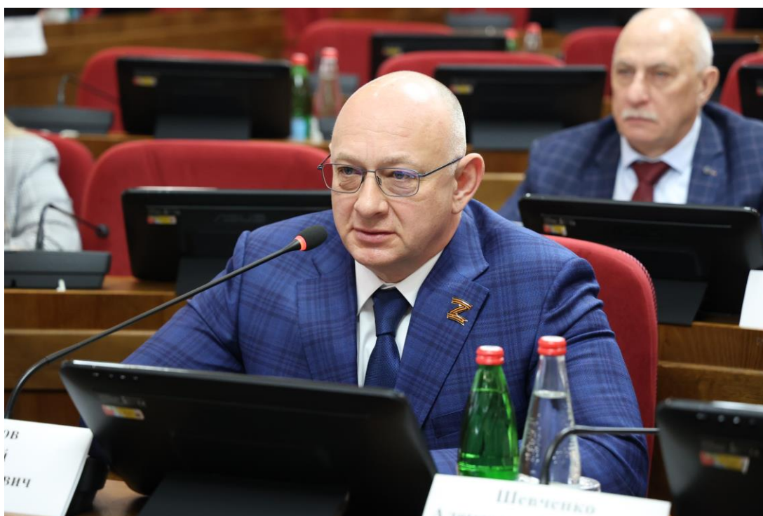
С.В. Шишов, временно исполняющий обязанности Уполномоченного по защите прав предпринимателей в Ставропольском крае