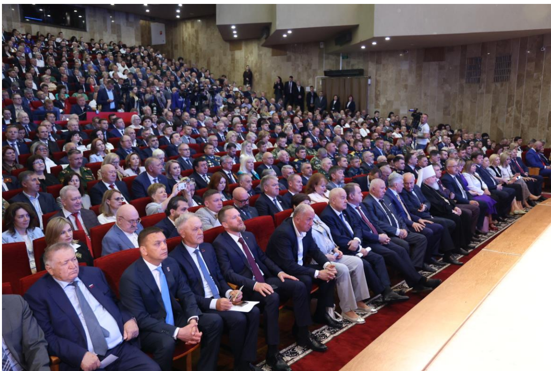
Заседание Думы Ставропольского края

В соответствии с Законом Ставропольского края от 14 октября 2002 года № 43-кз "Об осуществлении Думой Ставропольского края контроля за соблюдением и исполнением законов Ставропольского края" комитетом за отчетный период осуществлялся контроль за исполнением законов Ставропольского края и других нормативных правовых актов Ставропольского края.