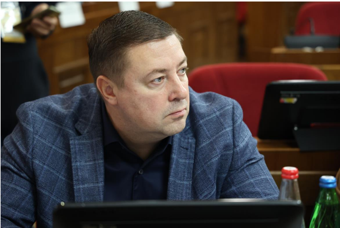
А.А. Мясоедов, министр имущественных отношений Ставропольского края