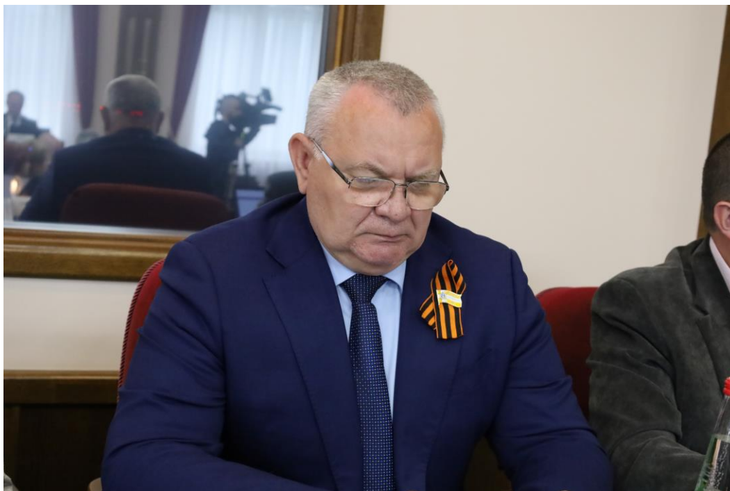
Ю.М. Коваленко, заместитель председателя Правительства Ставропольского края

3) от 22 мая 2025 года № 1497-VII ДСК "Об отчете Губернатора Ставропольского края о результатах деятельности Правительства Ставропольского края за 2024 год, в том числе по вопросам, поставленным Думой Ставропольского края, и о ежегодном послании Губернатора Ставропольского края о социально-экономическом и общественно-политическом положении в Ставропольском крае, включающем основные направления бюджетной и налоговой политики Ставропольского края на 2025 год";