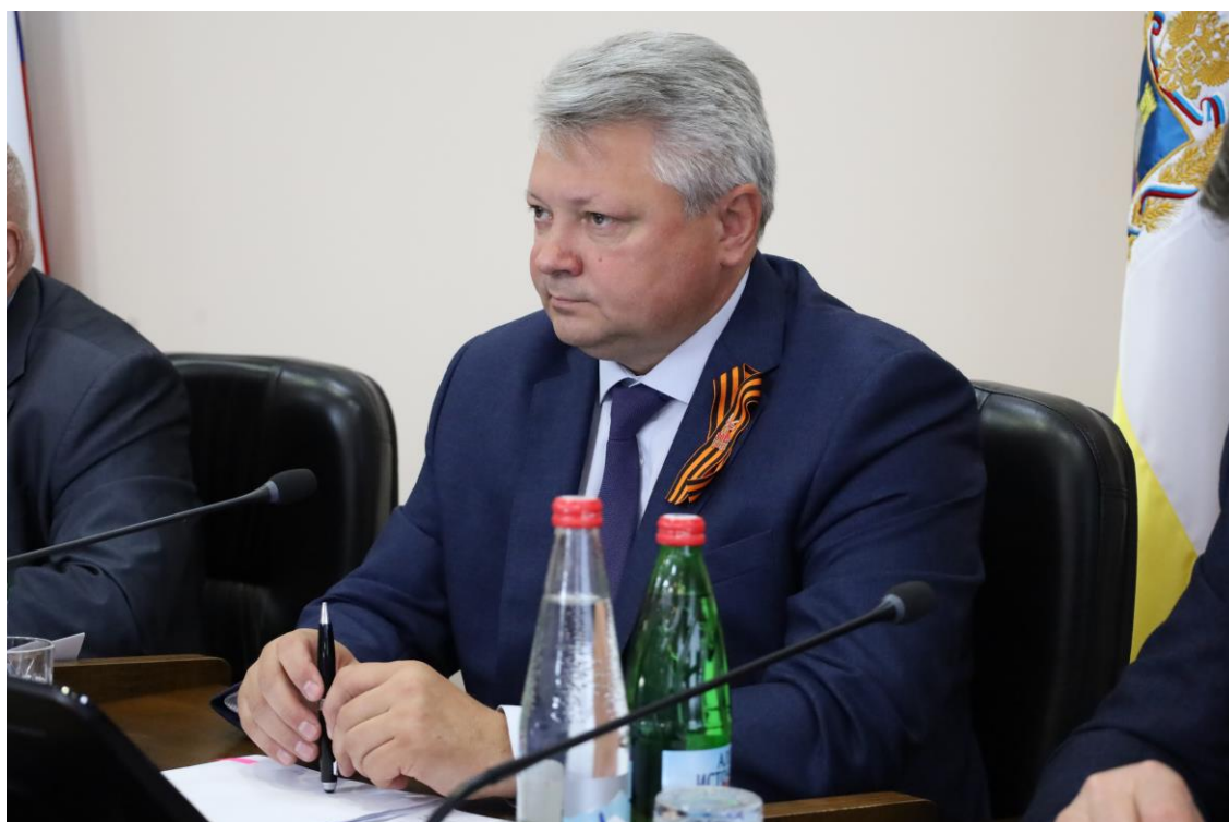
А.Г. Хлопянов, первый заместитель председателя Правительства Ставропольского края