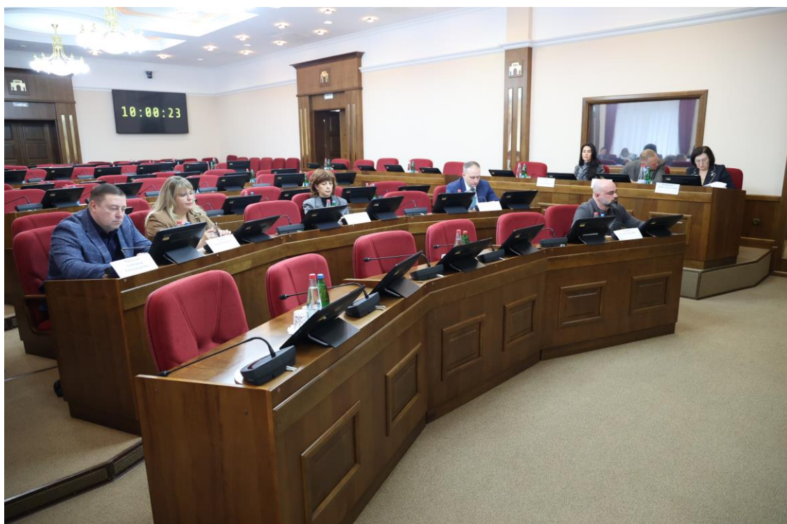
Совещание в комитете 13 ноября 2025 года