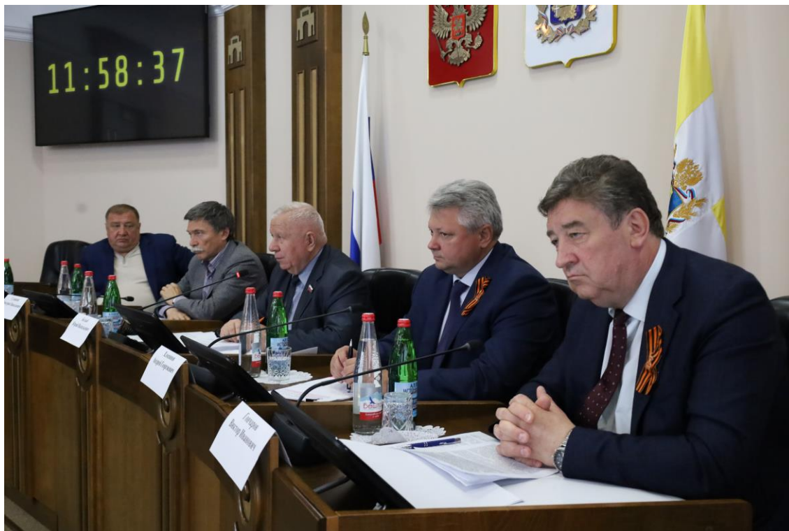
Заседание комитета 13 мая 2025 года

Об отчете Губернатора Ставропольского края о результатах деятельности Правительства Ставропольского края за 2024 год, в том числе по вопросам, поставленным Думой Ставропольского края, и о ежегодном послании Губернатора Ставропольского края о социально-экономическом и общественно-политическом положении в Ставропольском крае, включающем основные направления бюджетной и налоговой политики Ставропольского края на 2025 год;