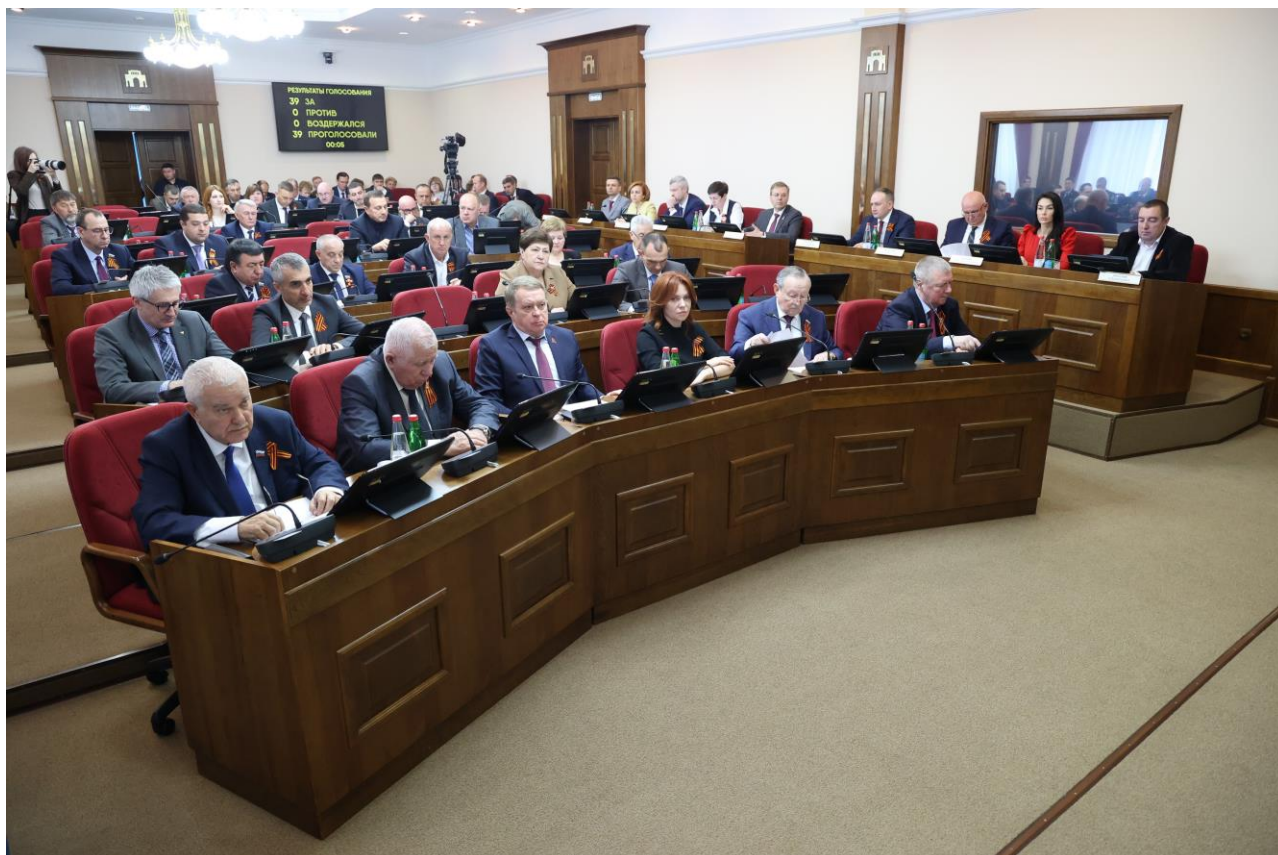
Заседание Думы Ставропольского края

Законом излагается в новой редакции статья 5 "Досрочное прекращение полномочий Уполномоченного" базового закона, которой устанавливаются случаи и порядок досрочного прекращения полномочий Уполномоченного по защите прав предпринимателей в Ставропольском крае по решению Губернатора Ставропольского края по согласованию с Уполномоченным при Президенте Российской Федерации по защите прав предпринимателей.