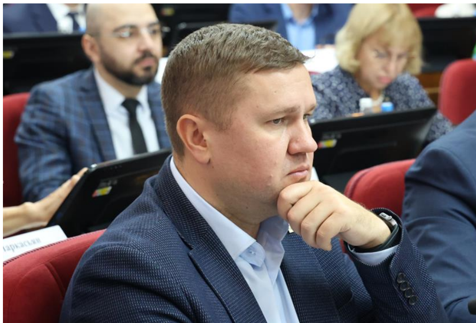
К.А. Ишков, министр сельского хозяйства Ставропольского края

от 27 октября 2025 года 1649-VII ДСК "Об отзыве на проект федерального закона № 1024775-8 "О внесении изменений в Федеральный закон "О государственном регулировании производства и оборота табачных изделий, табачной продукции, никотинсодержащей продукции и сырья для их производства" и статью 44 Федерального закона "Об общих принципах организации публичной власти в субъектах Российской Федерации";