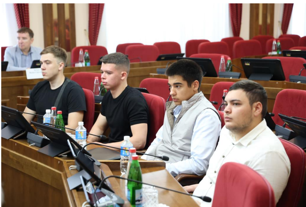
Совещание в комитете 24 июня 2025 года