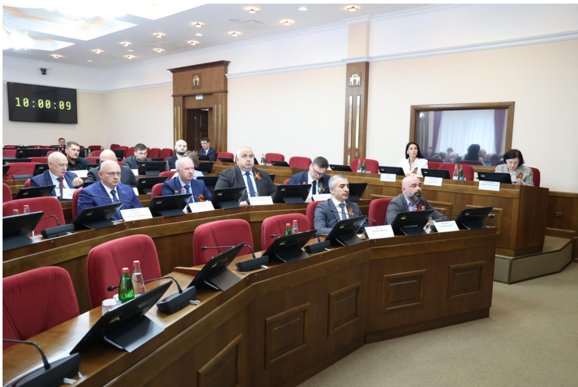
Заседание комитета 18 марта 2025 года

О проекте закона Ставропольского края № 498-7 "О проекте закона Ставропольского края "О внесении изменений в статьи 3 и 5 Закона Ставропольского края "Об Уполномоченном по защите прав предпринимателей в Ставропольском крае";