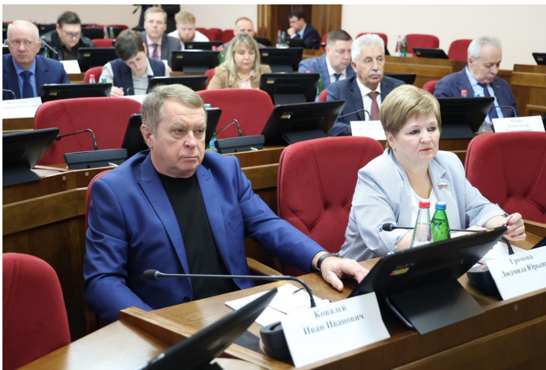
Заседание комитета 18 ноября 2025 года

О прогнозе социально-экономического развития Ставропольского края на 2026 год и на период до 2028 года;