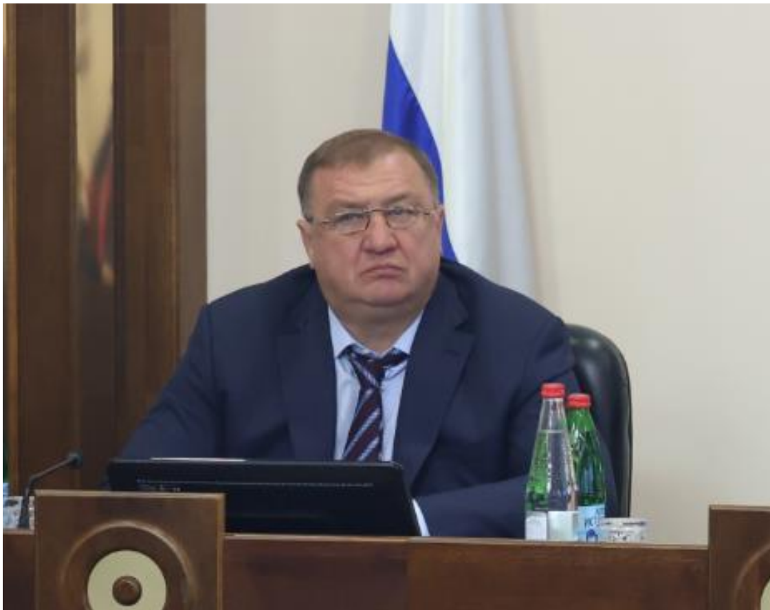
А.А. Петренко, первый заместитель председателя Думы Ставропольского края, член комитета

Передача полномочий требует передачи финансовых и материальных ресурсов от муниципальных образований Ставропольскому краю.