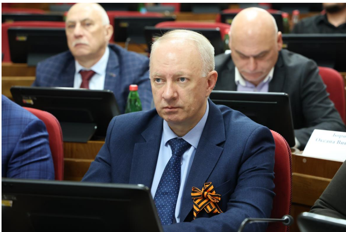
А.В. Шевченко, председатель комитета Ставропольского края по государственным закупкам