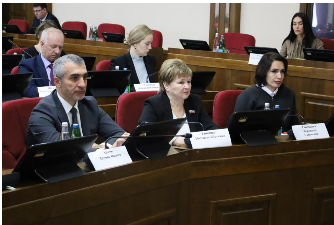
Заседание комитета 9 декабря 2025 года

О плане работы комитета Думы Ставропольского края по экономическому развитию и собственности на январь 2026 года.