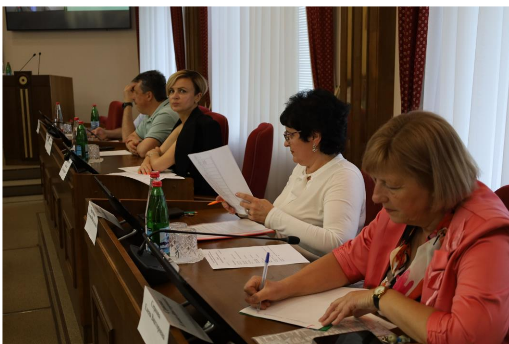
Заседание комитета 8 июля 2025 года

О проекте закона Ставропольского края № 546-7 "О некоторых вопросах в сфере креативных (творческих) индустрий в Ставропольском крае";