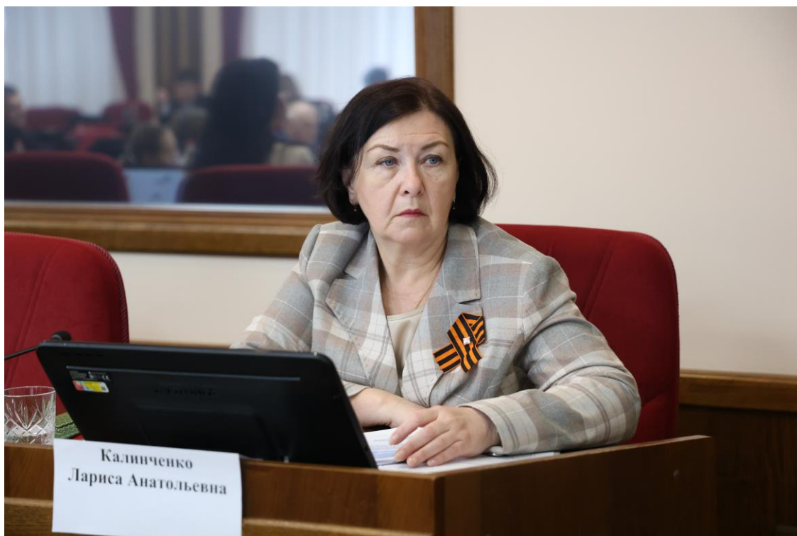
Л.А. Калининко, заместитель председателя Правительства Ставропольского края – министр финансов Ставропольского края