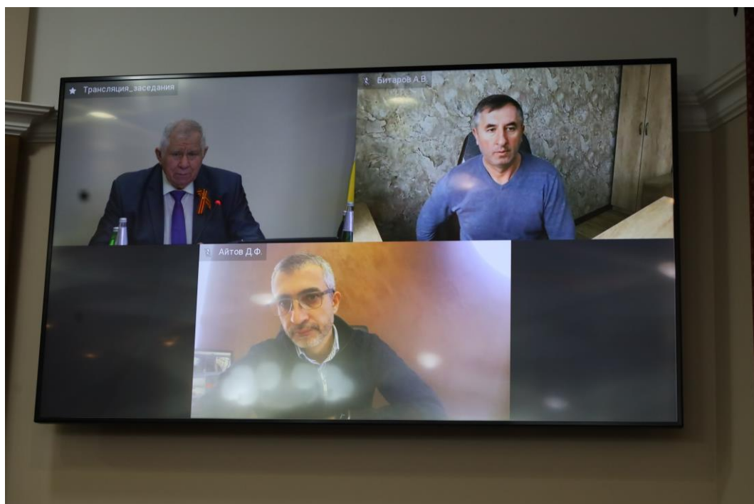
Совещание в комитете 6 февраля 2025 года