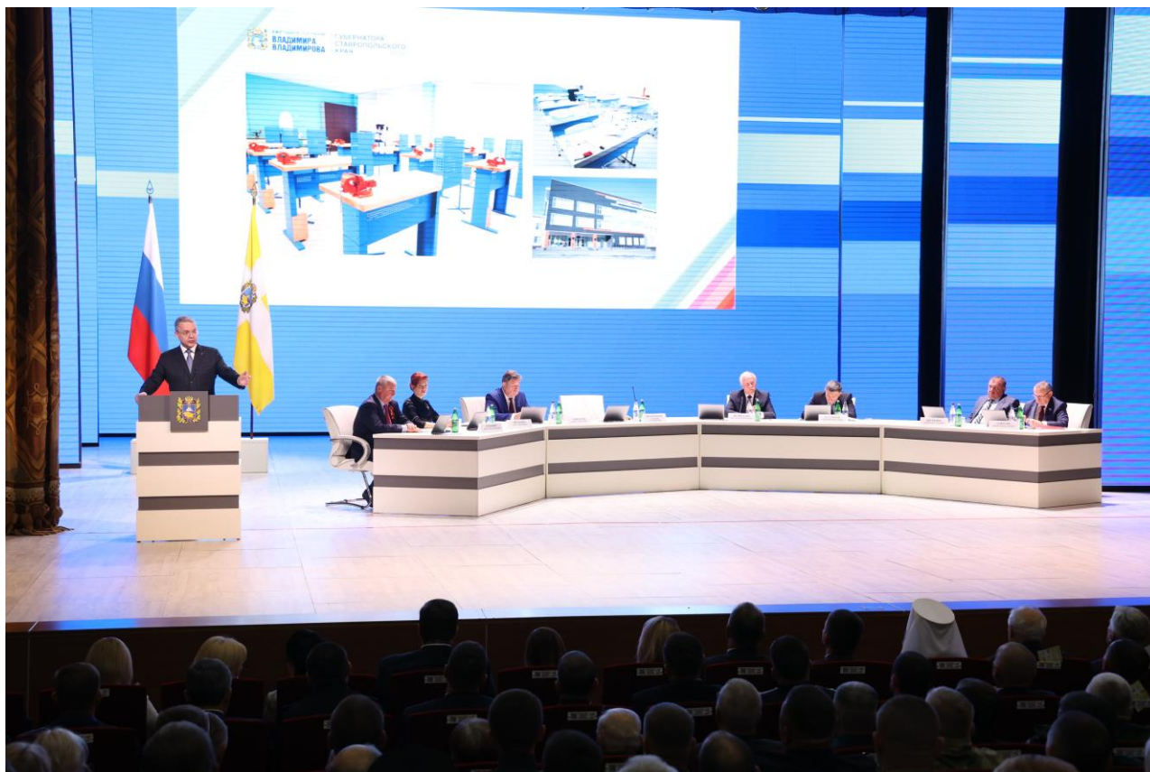
Заседание Думы Ставропольского края

Закон Ставропольского края от 25 февраля 2025 г. № 14-кз "О внесении изменений в Закон Ставропольского края "О соглашениях Ставропольского края об осуществлении международных и внешнеэкономических связей" (законопроект № 494-7)