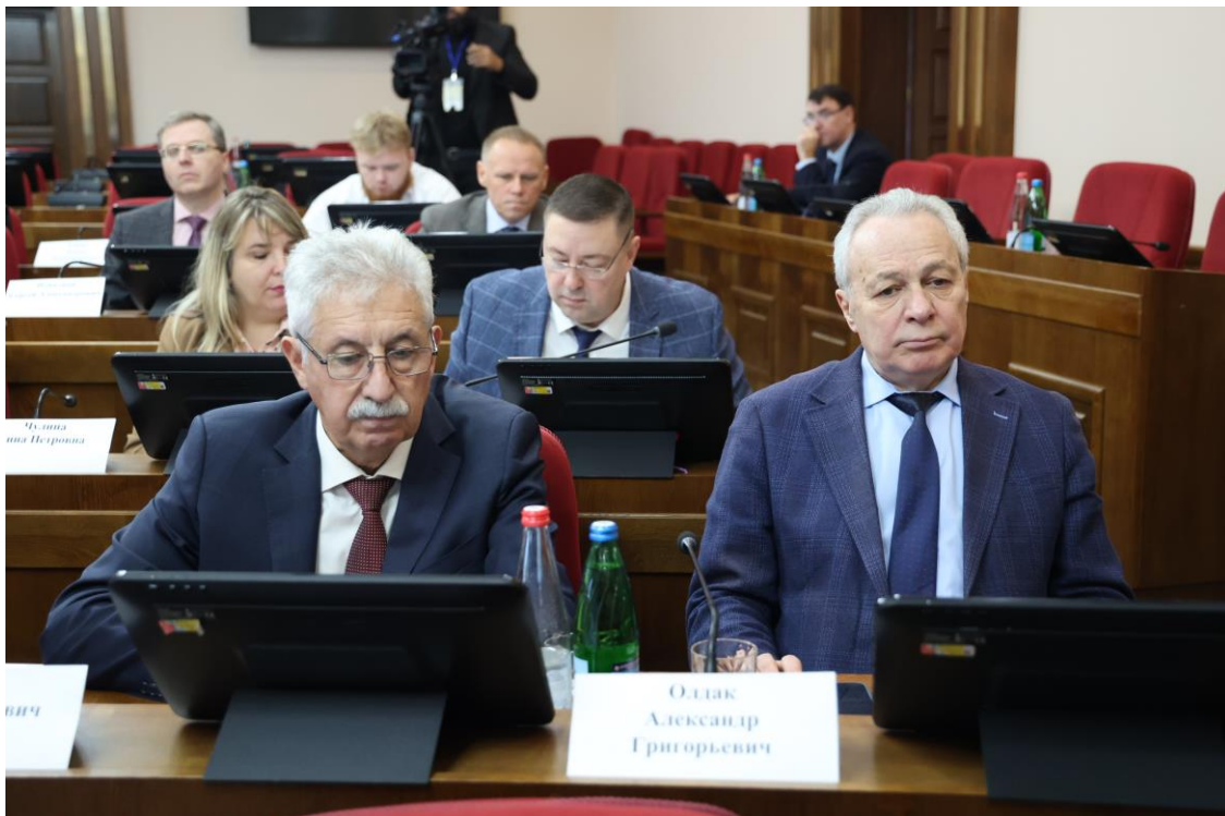
Заседание комитета 18 ноября 2025 года