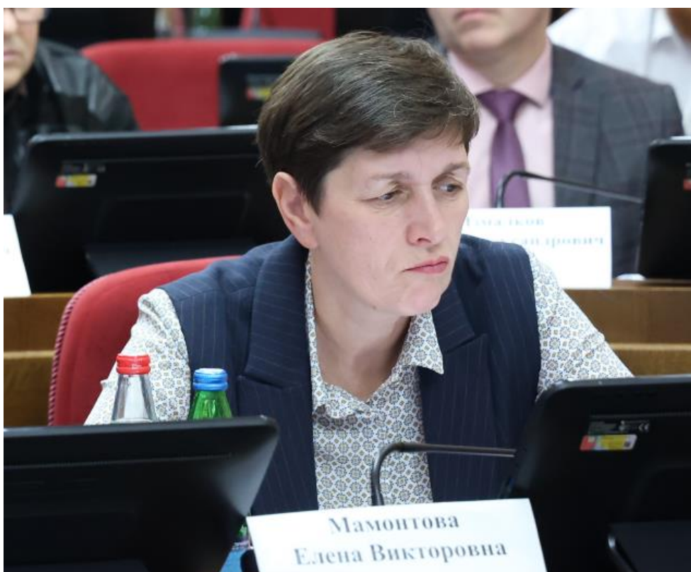
Е.В. Мамонтова, министр труда и социальной защиты населения Ставропольского края