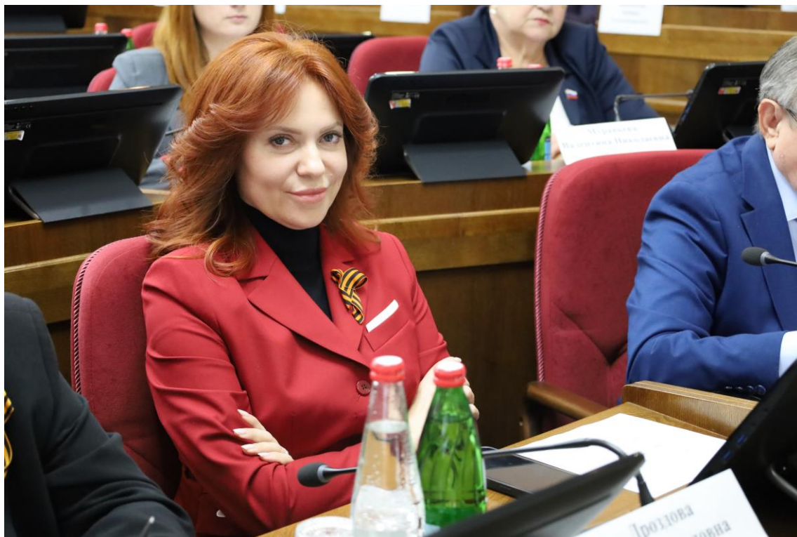
О.П. Дроздова, заместитель председателя Думы Ставропольского края