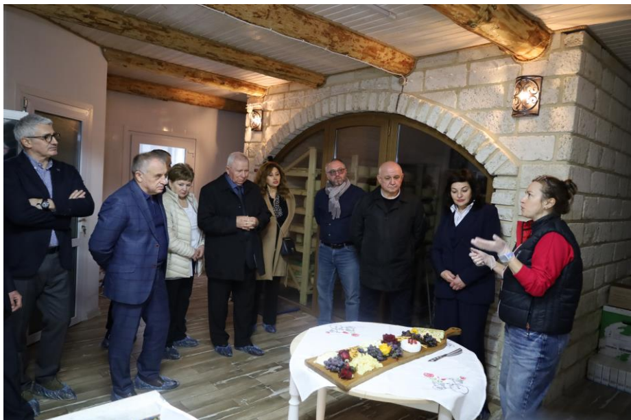
Выездное совещание в комитете 21 ноября 2025 года