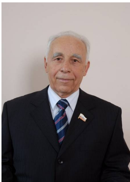
Гоноченко Алексей Алексеевич – член комитета, председатель Совета старейшин при председателе Думы Ставропольского края