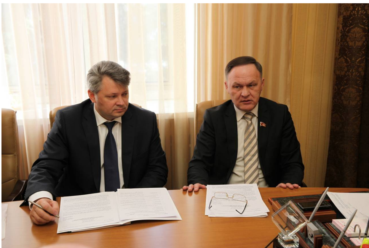
Заседание рабочей группы