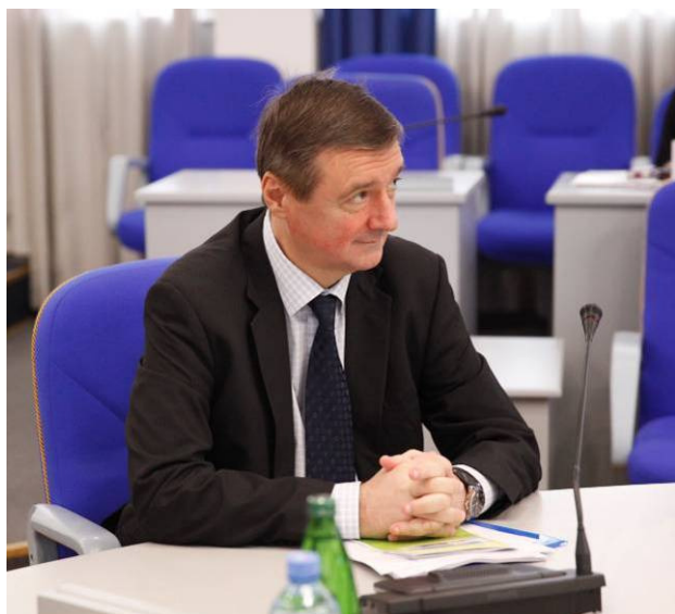
Кузьмин А.С. заместитель председателя Думы