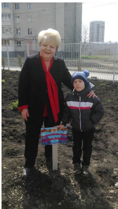
Открытие детского сада в г. Невинномысске