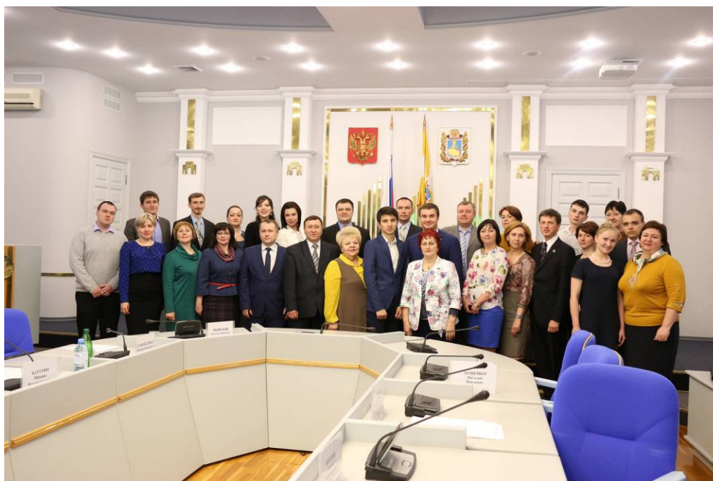
Участники встречи с Советом молодых ученых и специалистов кра

■ Встреча с Советом молодых ученых и специалистов Ставропольского края, победителями программ "УМНИК", "СТАРТ";