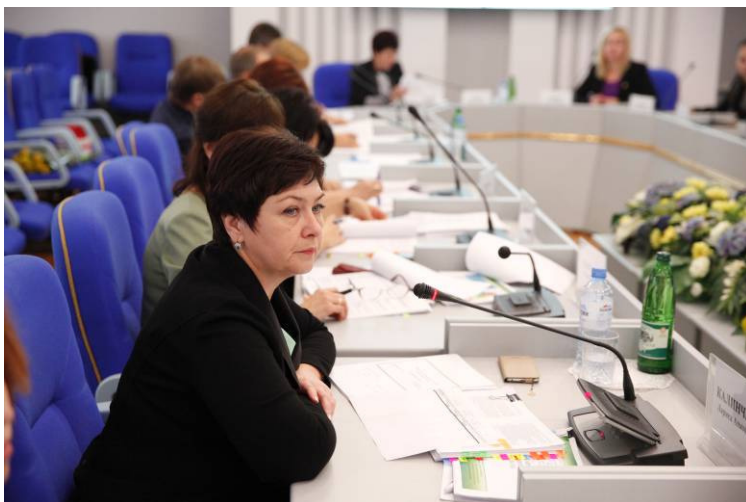
Л.А.Калинченко - заместитель председателя Правительства края – министр финансов края

Ставропольскому краю, органами исполнительной власти края и местного самоуправления.