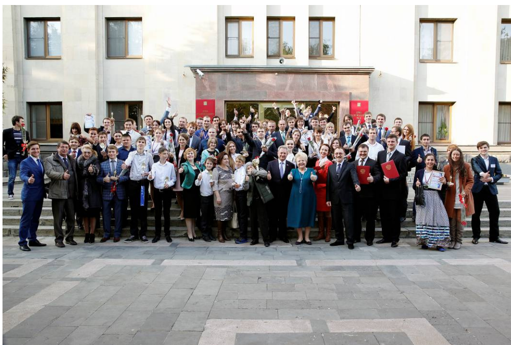
Участники церемонии награждения конкурса "УМНИК"

- "Инновации молодых ученых Ставрополя – России" (на базе Ставропольского государственного педагогического института, октябрь).