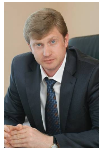
И.А.Васильев – министр строительства, транспорта и дорожного хозяйства края