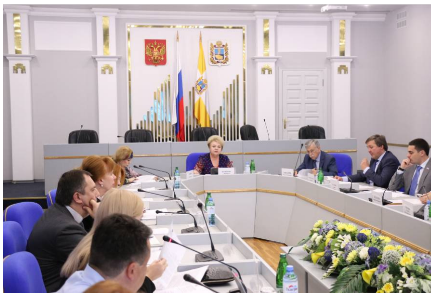
Заседание комитета по обсуждению вопросов кадетского образования, патриотического воспитания

За 9 месяцев 2015 года по Ставропольскому краю произведено 97018 актов записей.