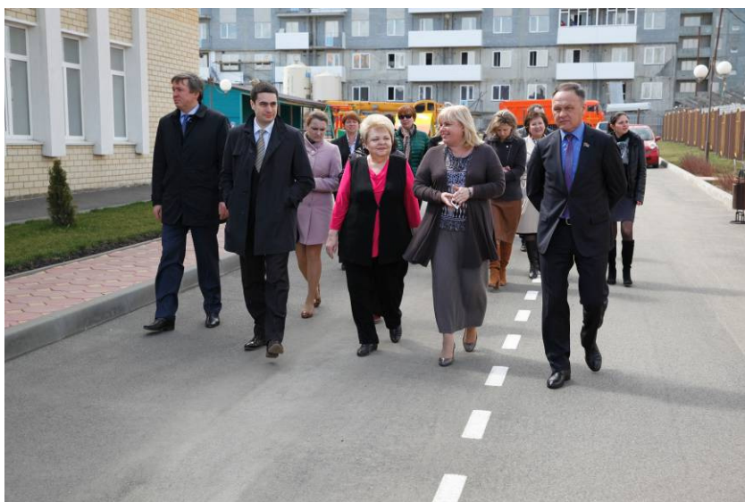
Выездное совещание по вопросам доступности дошкольного образования в г. Ставрополе

- реализации в крае проекта модернизации дошкольного образования ( декабрь );