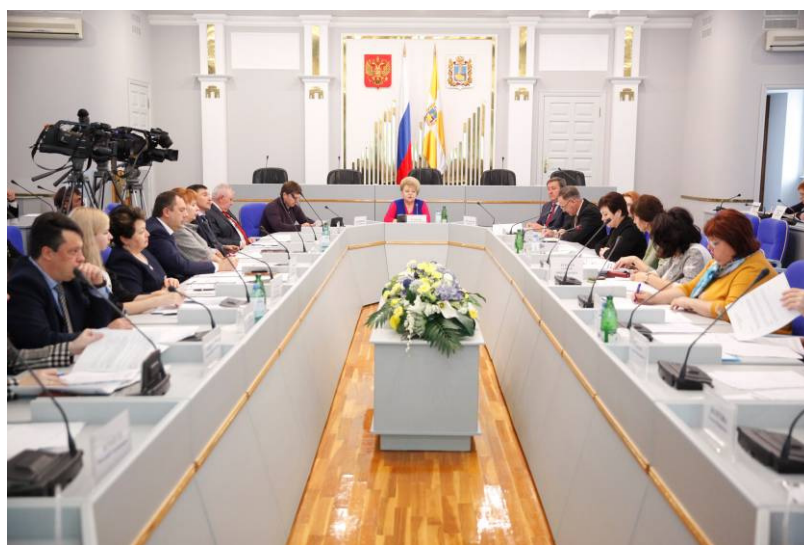
Заседание комитета по вопросу бюджетной обеспеченности курируемых отраслей