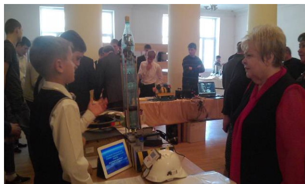
Выставка "Таланты 21 века"