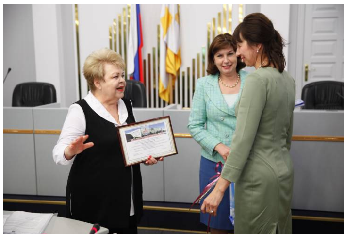
И.В. Маркасян – первый заместитель министра финансов края