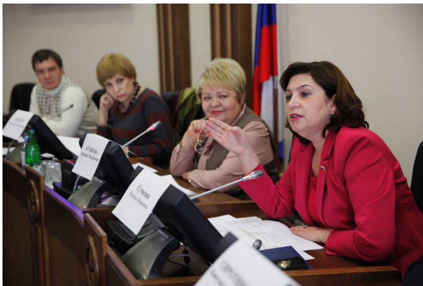
Заседание комитета по вопросу подготовки педагогических кадров для дошкольных образовательных организациях

- подготовки педагогических кадров для дошкольных образовательных организаций ( март );