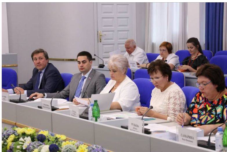
И.В.Кувалдина - заместитель председателя Правительства края