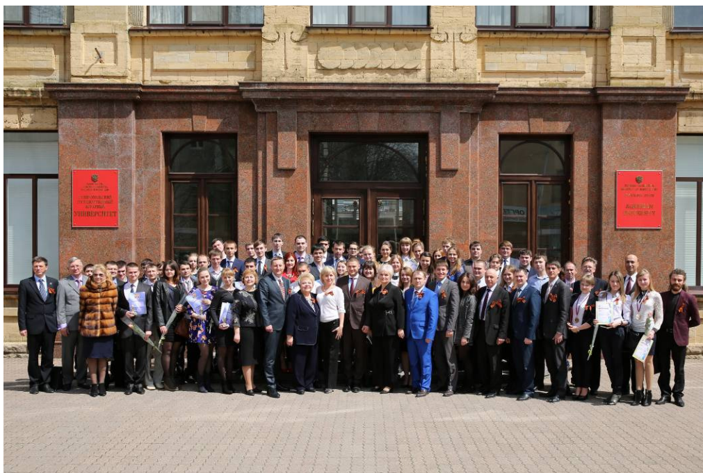
Участники церемонии награждения конкурса "УМНИК"

- "Инновации молодых ученых Северного Кавказа – экономике России" в рамках конкурса УМНИК-2015 (на базе Ставропольского государственного аграрного университета, апрель);