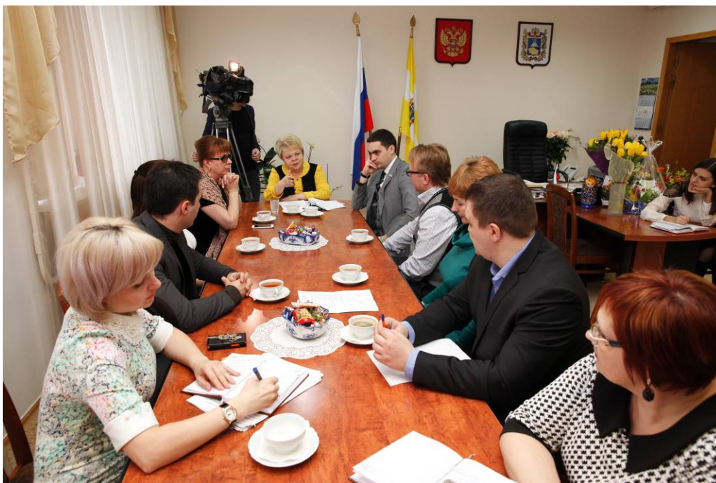
Участники встречи с молодыми учеными-обладателями гранта Президента РФ

■ Встреча с Советом молодых ученых и специалистов Ставропольского края, победителями программ "УМНИК", "СТАРТ";