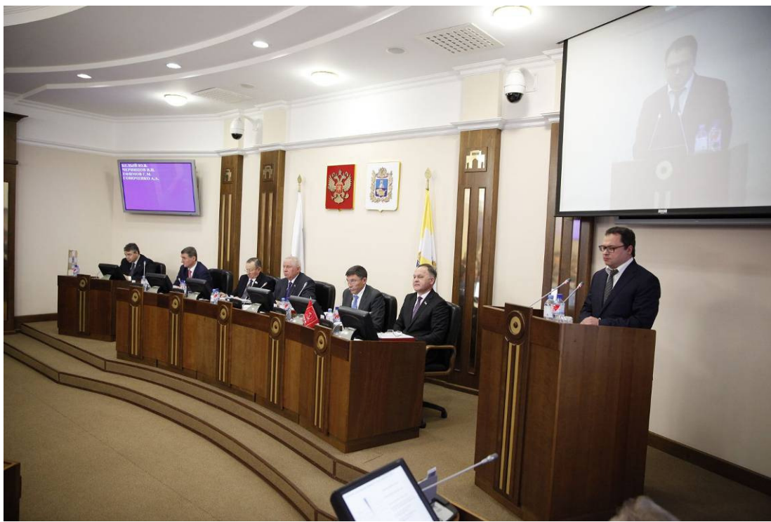
Выступление А.А. Газарова на "Правительственном часе"

В 2015 году обеспечено жилыми помещениями 414 человек из числа детей-сирот, детей, оставшихся без попечения родителей, а также лиц из их числа (больше уровня 2014 года на 81 квартиру).