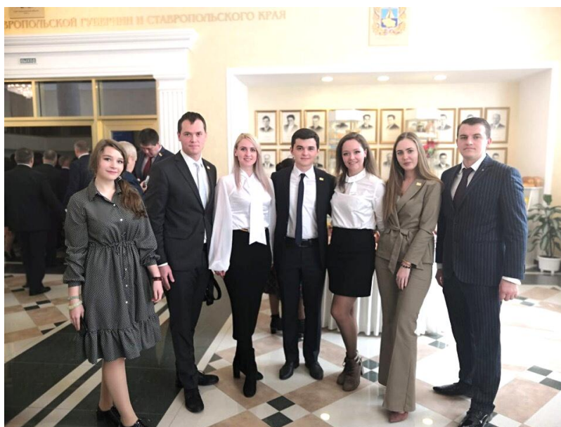
Члены Молодежного парламента при Думе Ставропольского края – участники X Конференции Северо-Кавказской Парламентской Ассоциации и мероприятий, посвященных 25-летию Думы Ставропольского края, 4 апреля 2019 г.

- в юбилейной X Конференции Северо-Кавказской Парламентской Ассоциации и мероприятиях, посвященных 25-летию Думы Ставропольского края