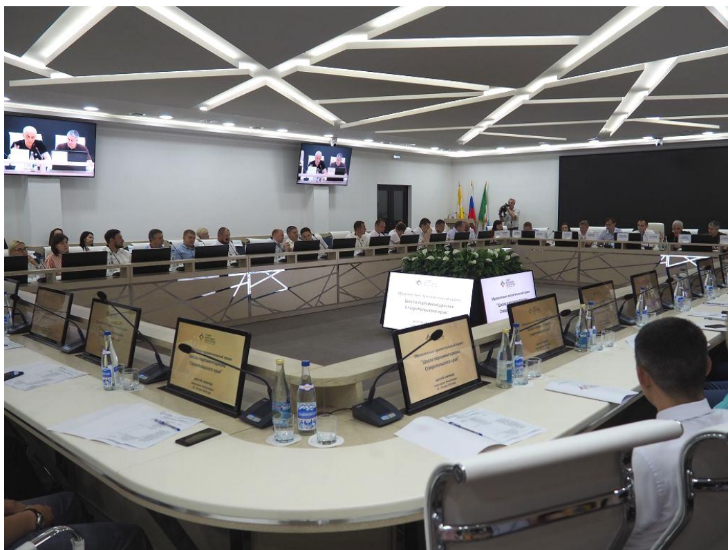
Общее собрание Совета молодых депутатов Ставропольского края, город-курорт Железноводск, июнь 2019 г.

Обсуждались вопросы административной ответственности за нарушение законодательства в сфере обращения с твердыми коммунальными отходами, благоустройства придомовых территорий многоквартирных домов, обеспечения жильем инвалидов, капитального ремонта дошкольных образовательных организаций и учреждений дополнительного образования, участия Совета молодых депутатов Ставропольского края в работе направления "Развитие молодежного парламентаризма в Северо-Кавказском федеральном округе" образовательной программы Северо-Кавказского молодежного форума "Машук-2019".