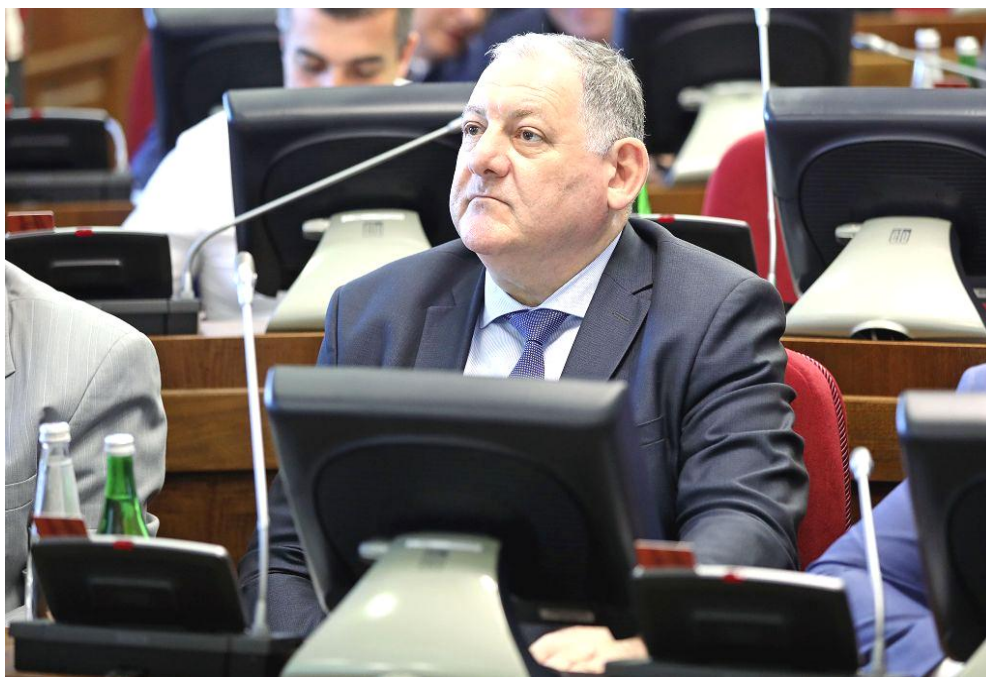
А.П. Горбунов на заседании Думы Ставропольского края

Средства на эти цели предусмотрены в бюджете Ставропольского края на 2019 год.