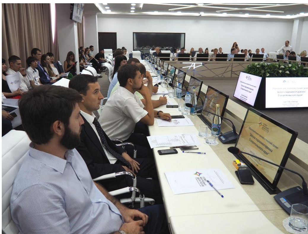
Шестой семинар образовательно-просветительского проекта Совета молодых депутатов Ставропольского края "Школа парламентаризма Ставропольского края", город-курорт Железноводск, июнь 2019 г.

Проведен шестой семинар образовательно-просветительского проекта Совета молодых депутатов Ставропольского края "Школа парламентаризма Ставропольского края". В мероприятиях семинара приняли участие депутаты Думы Ставропольского края, представители органов исполнительной власти и органов местного самоуправления Ставропольского края, а также член Совета Федерации Федерального Собрания Российской Федерации Д.А. Шатохин, председатель Ульяновской Городской Думы, председатель комитета Палаты молодых законодателей при Совете Федерации Федерального Собрания Российской Федерации по федеративному устройству, региональной политике и местному самоуправлению И.В. Ножечкин.