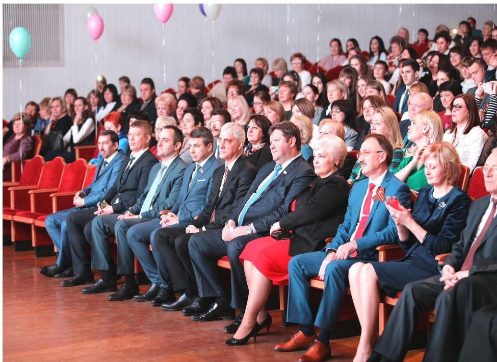
Чествование победителей Всероссийских конкурсов "Учитель года России – 2019" и "Воспитатель года России – 2019"

II. награждение победителей краевого этапа Всероссийского конкурса "Учитель года России – 2019" в номинации "Шаг в профессию" ценными подарками Думы Ставропольского края.