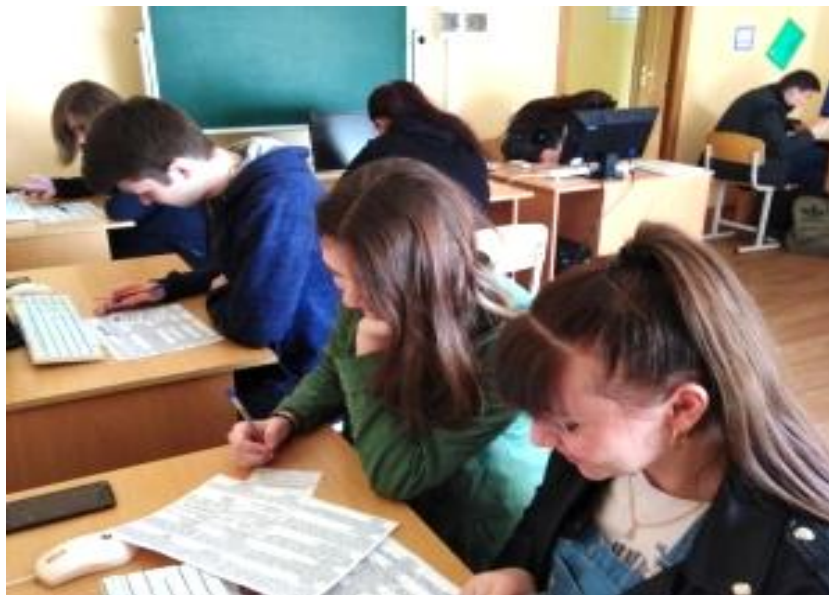
Проведение Международной акции "Тест по истории Великой Отечественной войны", 26 апреля 2019 г.

вание проходило в режиме онлайн и на 708 площадках, организованных на базе образовательных организаций Ставропольского края. По итогам проведения теста Ставропольский край стал лучшим по количеству организованных площадок тестирования. Средний возраст ставропольцев, участвовавших в тестировании, составил 19,51 лет; средний балл – 15,17.