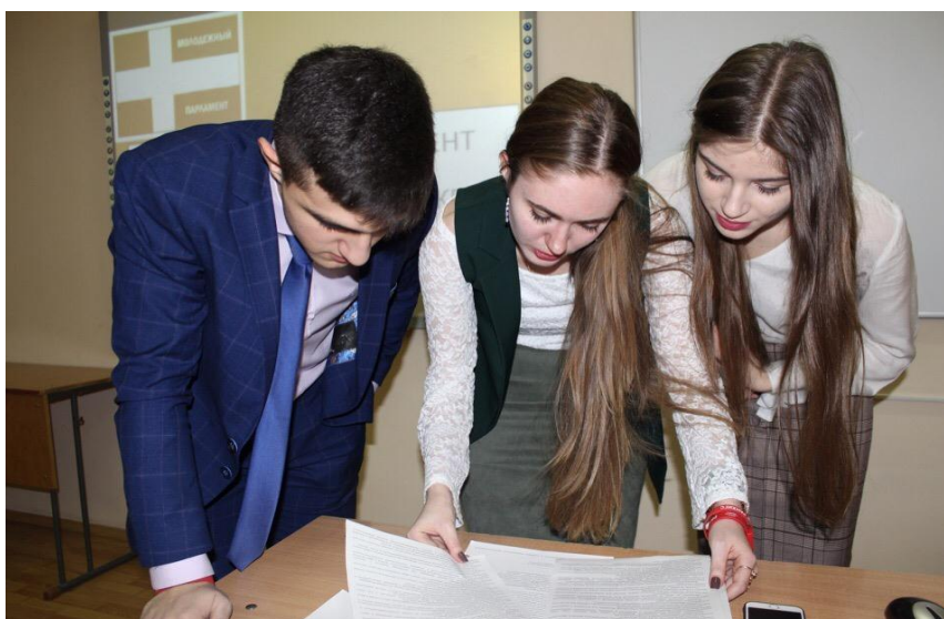
Работа площадки Молодежного парламента на мероприятии в Северо-Кавказском институте-филиале РАНХиГС, февраль 2019 г.

Представители Молодежного парламента выступили соорганизаторами тренингов и мастер-классов, состоявшихся в Северо-Кавказском институте-филиале Российской академии народного хозяйства и государственной службы при Президенте Российской Федерации, где рассказали школьникам и студентам о деятельности Молодежного парламента при Думе Ставропольского края.