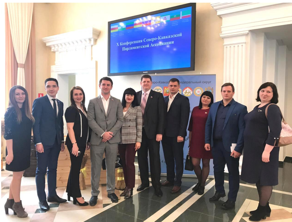
Члены Совета молодых депутатов Ставропольского края перед началом X Конференции Северо-Кавказской Парламентской Ассоциации, 4 апреля 2019 г.

- в X Конференции Северо-Кавказской Парламентской Ассоциации