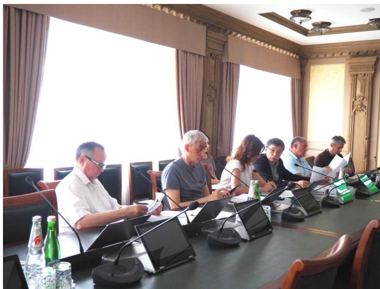
Заседание комиссии по проведению конкурса законотворческих и социально значимых проектов, 27 июня 2019 г.

Конкурсной комиссией проведено 8 собеседований с участниками конкурса законотворческих и социально значимых проектов, в которых приняли участие 72 человека. В их числе: 55 человек – самовыдвиженцы, 14 – делегированы образовательными организациями высшего образования и профессиональными образовательными организациями Ставропольского края, 2 – кандидаты от профсоюзных организаций, 6 человек выдвинуты от общественных объединений. С двумя участниками конкурса собеседования проведены в режиме онлайн. На собеседованиях кандидаты в Молодежный парламента представили депутатам Думы Ставропольского края свои конкурсные проекты.