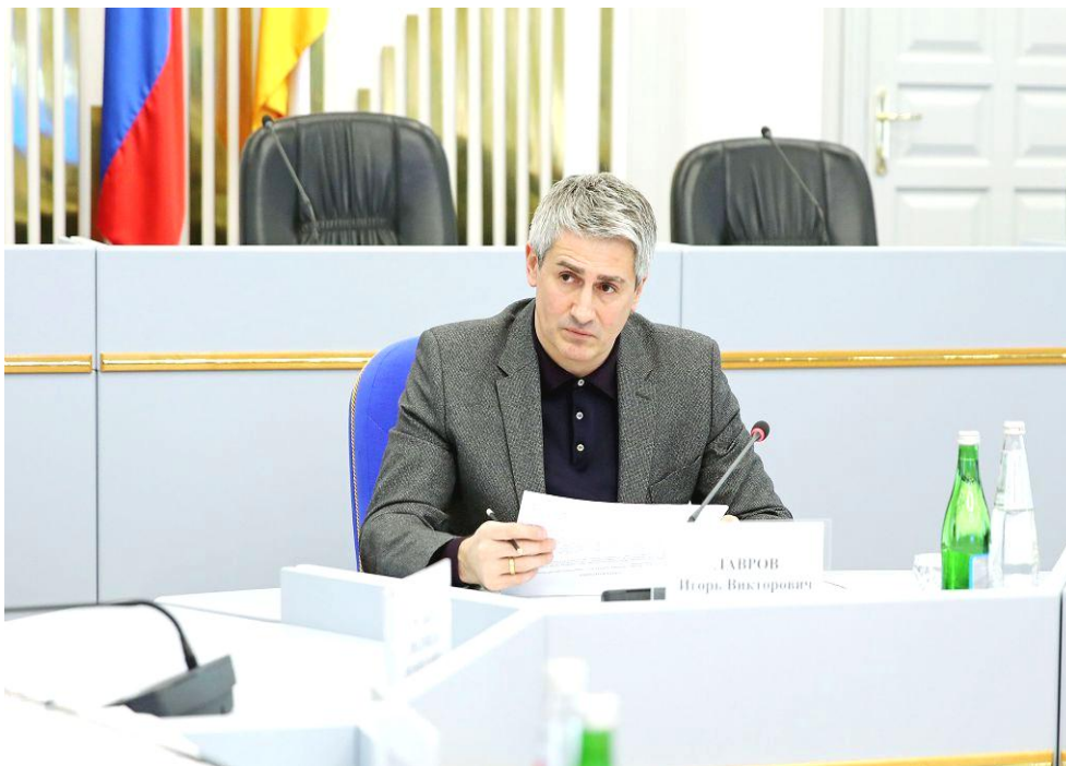
И.В. Лавров на заседании комитета

ских партий, представленных в Думе Ставропольского края, при освещении их деятельности краевыми телеканалом и радиоканалом"