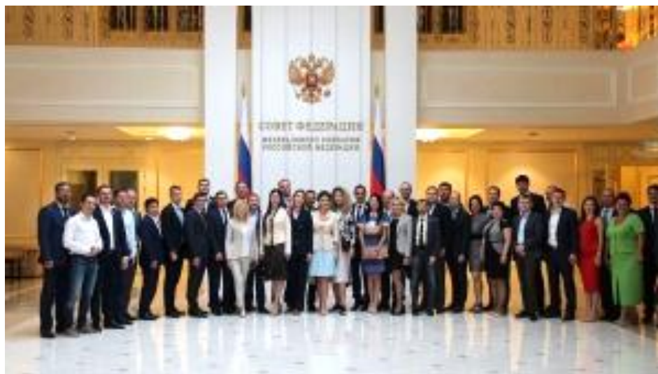
Участники образовательной сессии Палаты молодых законодателей при Совете Федерации Федерального Собрания Российской Федерации, Москва, июнь 2019 г.

- в образовательной сессии Палаты молодых законодателей при Совете Федерации Федерального Собрания Российской Федерации