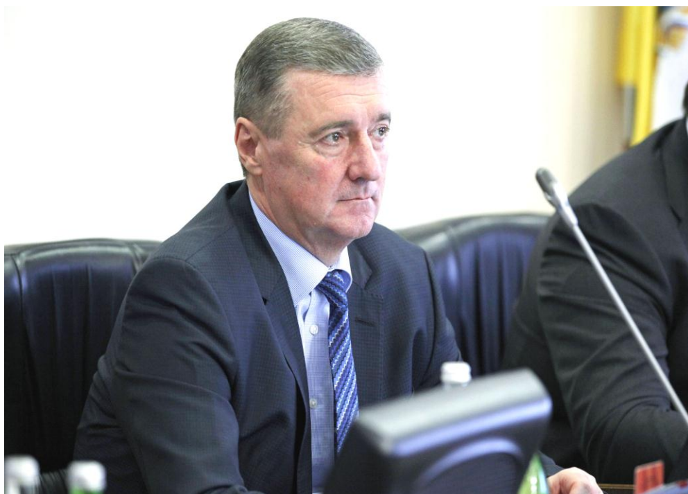
А.С. Кузьмин на заседании Думы Ставропольского края

Предусмотрел возможность досрочного прекращения его полномочий, на основании решения Губернатора края по согласованию с Уполномоченным по правам ребенка при Президенте России.