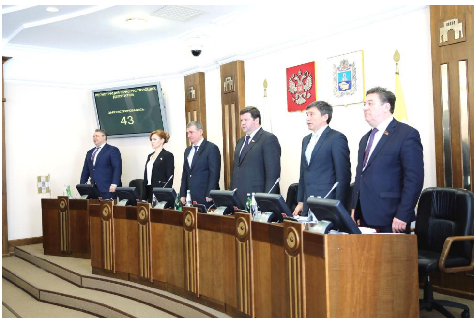
Заседание Думы Ставропольского края

Принятый закон не потребует выделения дополнительных финансовых средств из краевого бюджета.