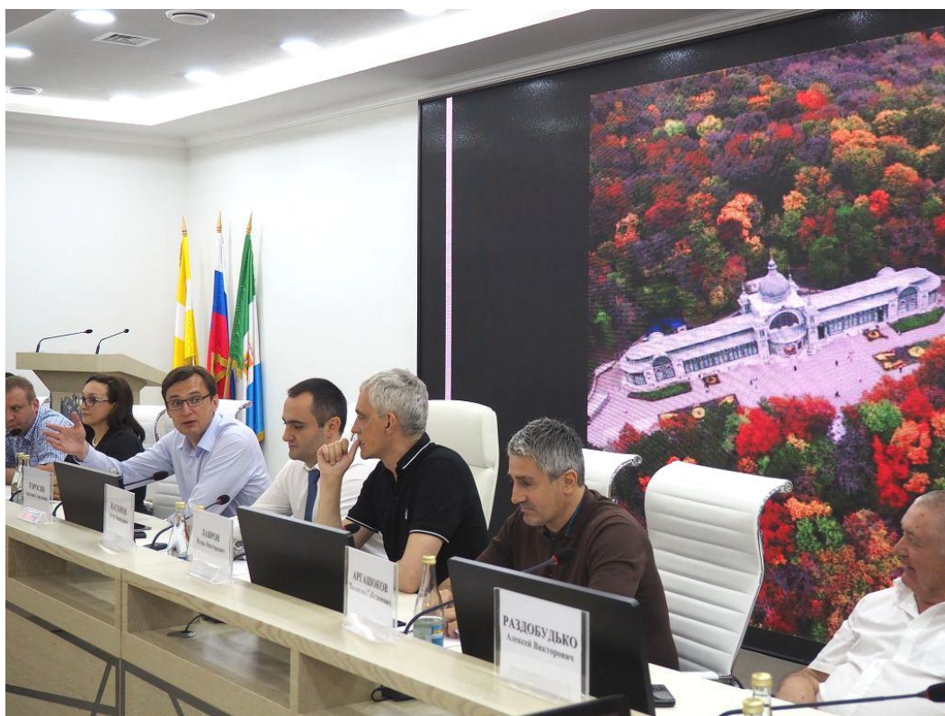
Шестой семинар образовательно-просветительского проекта Совета молодых депутатов Ставропольского края "Школа парламентаризма Ставропольского края", город-курорт Железноводск, июнь 2019 г.