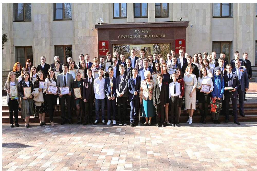
Участники церемонии награждения победителей краевого этапа Федерального конкурса "УМНИК – 2018"

Самым молодым участникам конкурса в качестве поощрения вручены специальные награды краевой Думы и губернатора Ставропольского края.