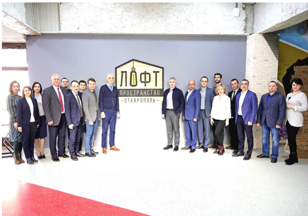
Участники выездного совещания комитета

В ходе совещания разговор неоднократно возвращался к теме развития в городах пространств, подобных "Лофту" в Ставрополе.