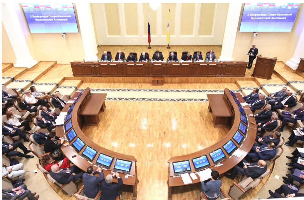
X Конференция Северо-Кавказской Парламентской Ассоциации, 4 апреля 2019 г.