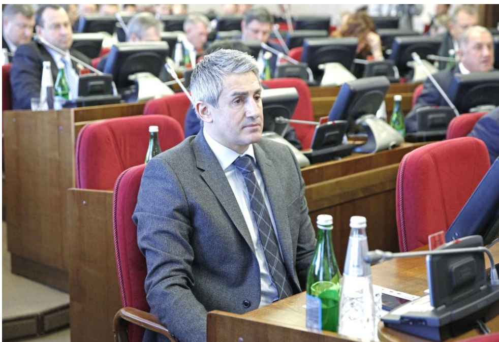
И.В. Лавров на заседании Думы Ставропольского края

Данное изменение направлено на установление надлежащих нормативных и иных условий организации бесплатной перевозки обучающихся в образовательных организациях Ставропольского края, реализующих основные общеобразовательные программы.