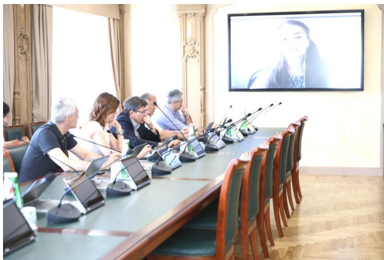
Собеседование в режиме онлайн с участниками конкурса законотворческих и социально значимых проектов, июнь 2019 г.

городов и районов края. Участвовали в конкурсе и представители предыдущего состава Молодежного парламента.