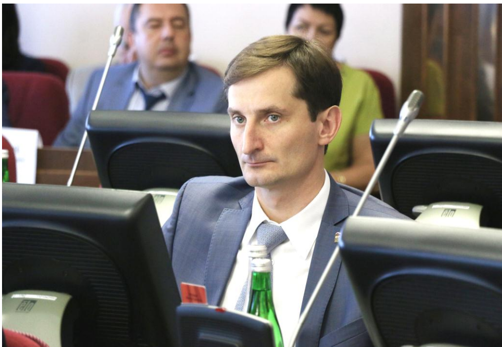
Р.А. Можейко на заседании Думы Ставропольского края

Привел действующий Закон в соответствие с требованиями федерального законодательства.