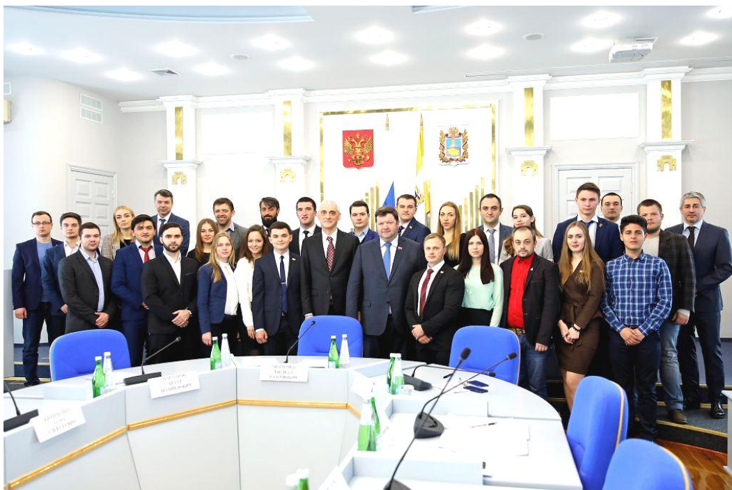
Итоговое заседание шестого состава Молодежного парламента при Думе Ставропольского края, 19 апреля 2019 г.

8. О международном молодежном парламентском движении.