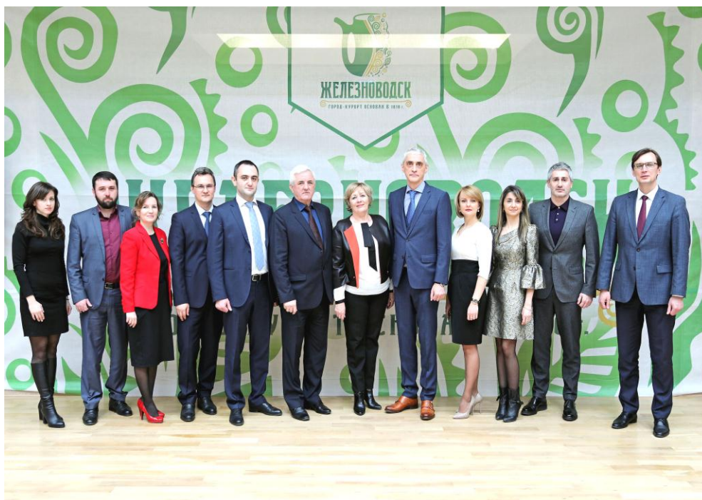
Участники выездного совещания комитета

На совещании депутаты выразили общую поддержку той работе, которая проводится в крае по увеличению посещения организаций культуры. Особенно это актуально для сельской местности, где Дома культуры – это центры притяжения для сотен местных жителей, в том числе школьников и молодежи.