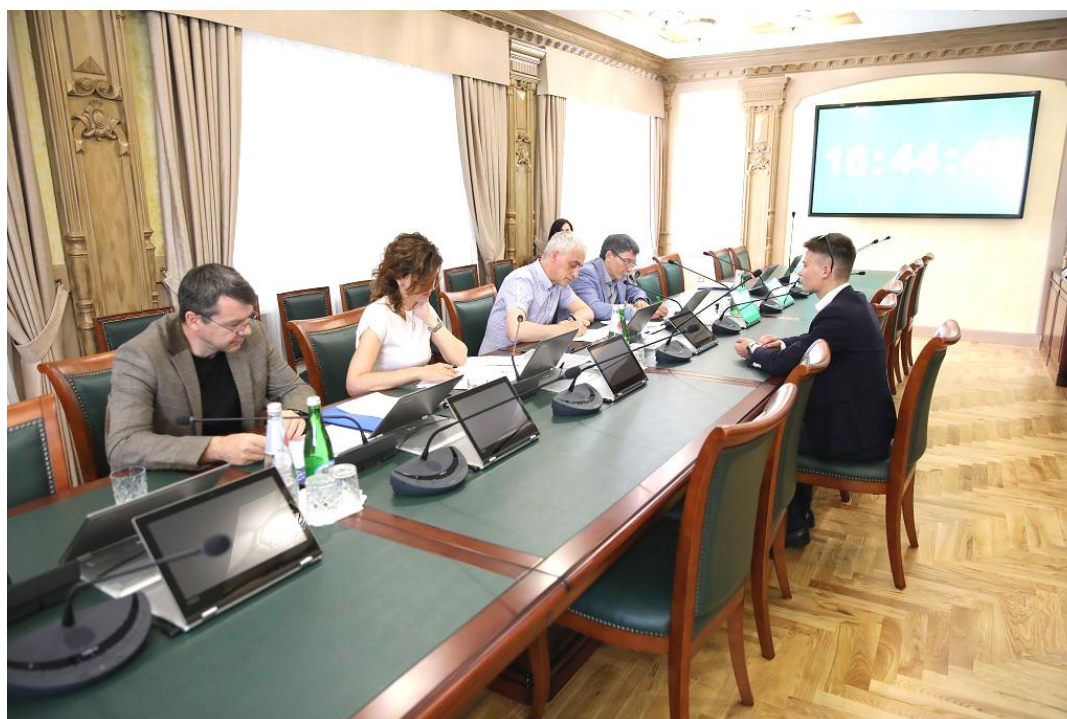
Собеседование с участниками конкурса законотворческих и социально значимых проектов, июнь 2019 г.

Для участия в конкурсе жители Ставропольского края в возрасте от 18 до 30 лет подавали проекты, направленные на решение проблем, волнующих современную молодежь. Конкурсантами были представлены законотворческие и социально значимые проекты, касающиеся вопросов молодежной политики, патриотического воспитания, охраны окружающей среды, развития массового спорта, молодежного парламентаризма, охраны здоровья граждан, информационного сотрудничества между молодежными структурами образовательных и общественных организаций края, межкультурного обмена, развития экологической культуры населения, улучшения городской среды, работы общественного транспорта, проведения благотворительных акций и др.