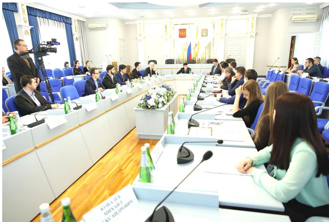
Заседание Молодежного парламента при Думе Ставропольского края, 19 апреля 2019 г.

Предлагаемые изменения направлены на создание преференций для инвесторов, реализующих на территориях Апанасенковского, Арзгирского, Курского, Левокумского, Нефтекумского, Степновского и Туркменского районов Ставропольского края особо значимые инвестиционные проекты, в виде дополнительных льгот по уплате налога на прибыль организации, подлежащего зачислению в бюджет Ставропольского края, в частности, при осуществлении капитальных вложений в рамках реализации особо значимых инвестиционных проектов на общую сумму свыше 100 миллионов рублей. Проект закона разработан в целях создания благоприятных условий для социально-экономического развития восточных территорий Ставропольского края.