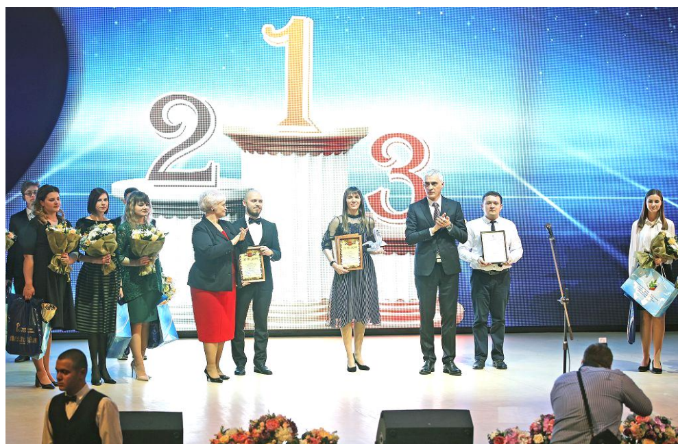
Чествование победителей Всероссийского конкурса "Учитель года России – 2019", "Воспитатель года России – 2019"

Премии краевого парламента также были вручены участникам конкурса, занявшим вторые и третьи места в номинациях