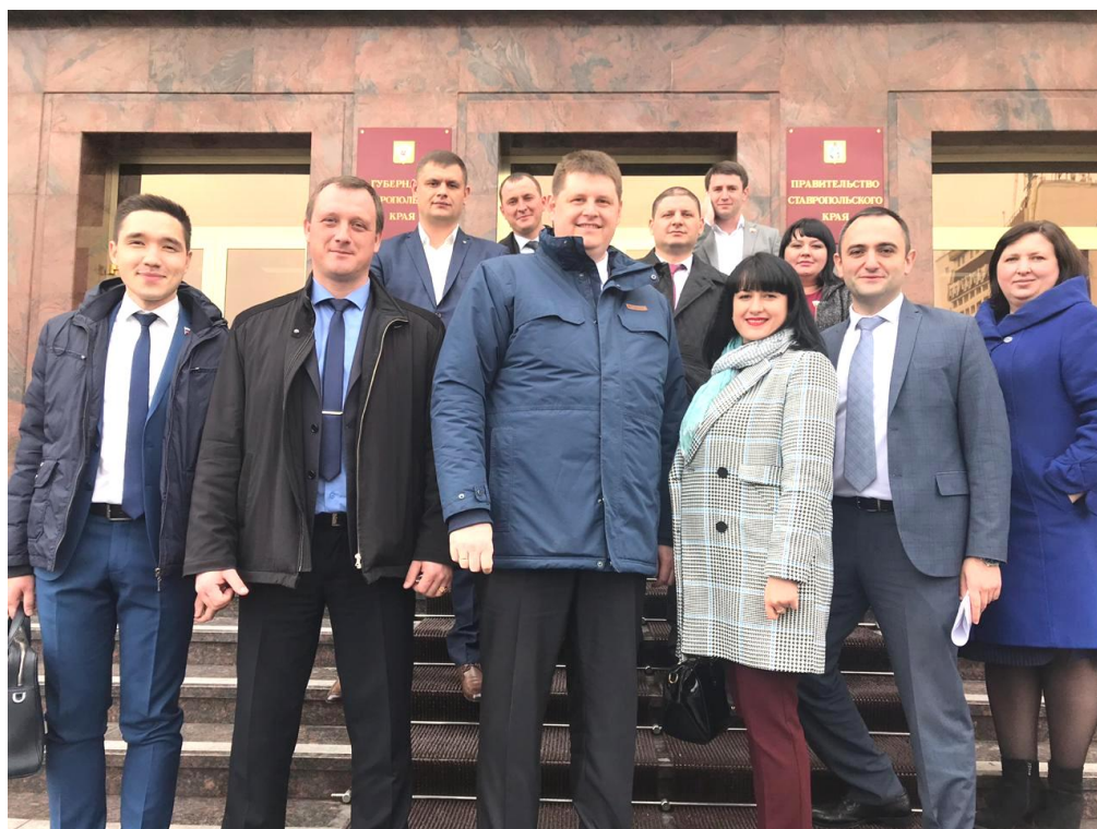
Члены Совета молодых депутатов Ставропольского края – участники мероприятий, посвященных 25-летию Думы Ставропольского края, 4 апреля 2019 г.

- в мероприятиях, посвященных 25-летию Думы Ставропольского края