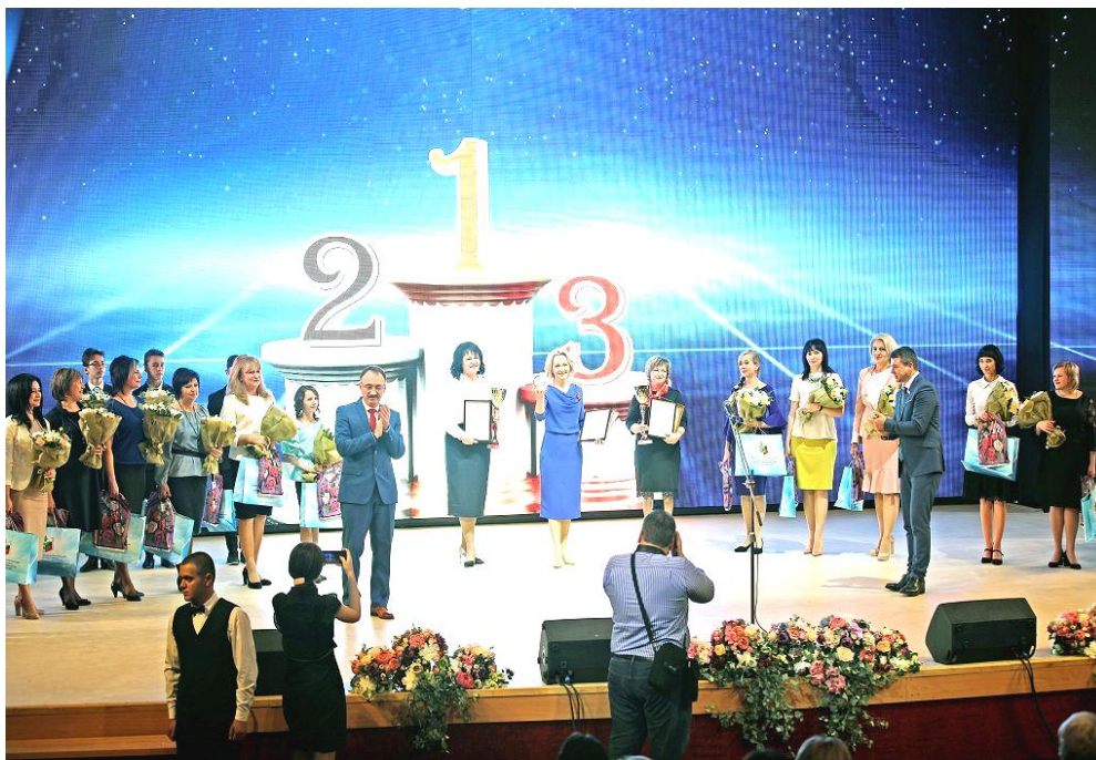
Чествование победителей Всероссийского конкурса "Учитель года России – 2019", "Воспитатель года России – 2019"

чили победительнице диплом, денежный сертификат на сумму 500 тысяч рублей, премию Думы в размере 70 тысяч и символ конкурса – жемчужину.