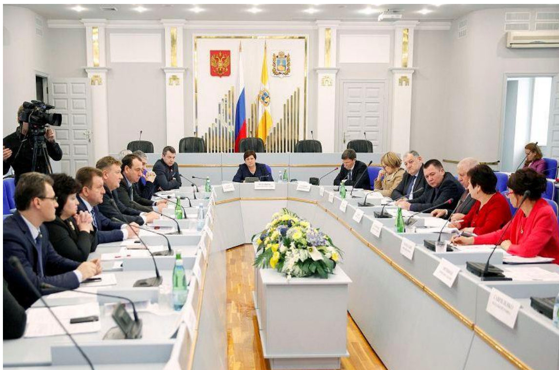
Заседание комитета по социальной и молодежной политике, образованию, науке, культуре и средствам массовой информации

В январе-феврале 2018 года осуществлял деятельность Комитет Думы Ставропольского края по социальной и молодежной политике, образованию, науке, культуре и средствам массовой информации.