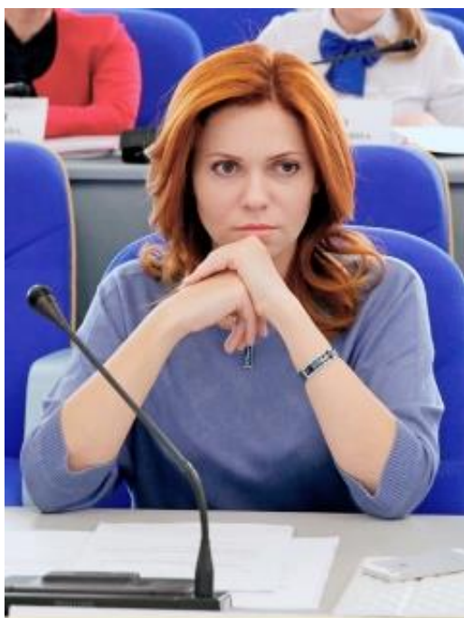
ДРОЗДОВА ОЛЬГА ПАВЛОВНА – заместитель председателя Думы Ставропольского края