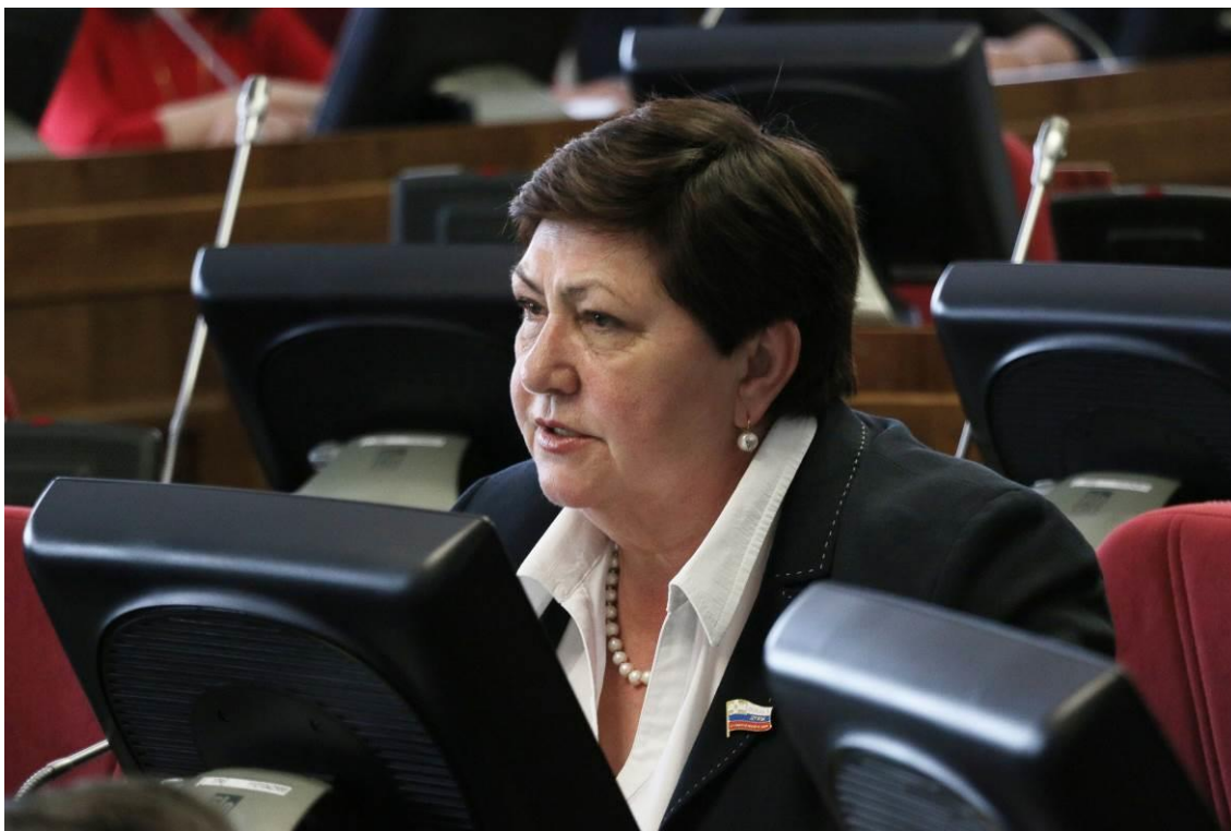
Председатель Комитета В.Н. Муравьева на заседании Думы Ставропольского края

Закон направлен на реализацию в Ставропольском крае полномочий по правовому регулированию налогообложения доходов иностранных граждан, осуществляющих трудовую деятельность в Российской Федерации на основании патента.