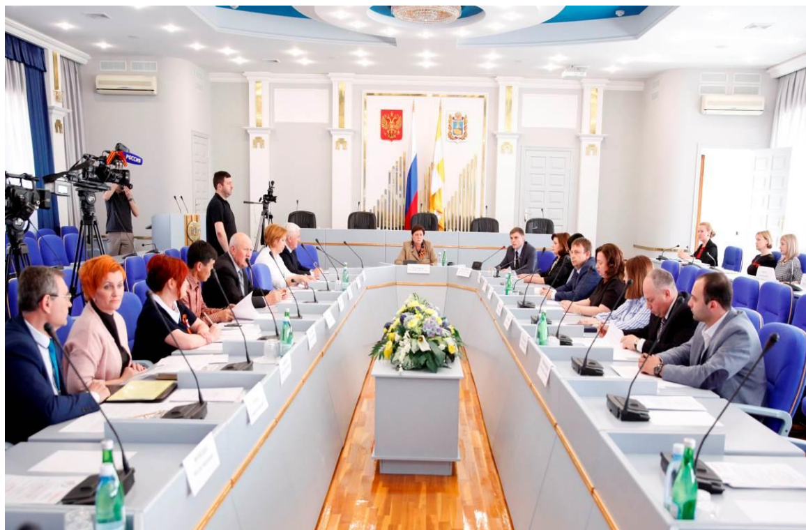
Заседание круглого стола

В обсуждении приняли участие представители министерства здравоохранения края, Ставропольского регионального отделения фонда социального страхования (далее – отделение ФСС в СК), ведомств, медицинских и образовательных организаций, а также работодателей Ставропольского края.