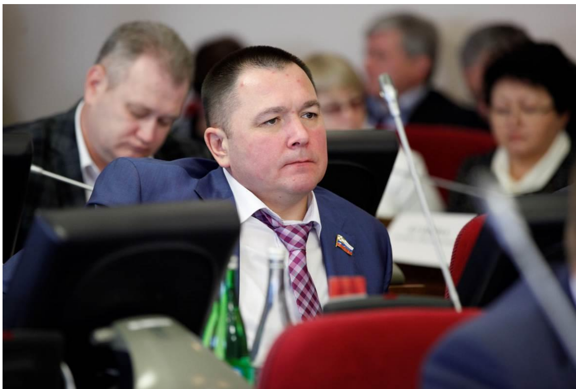
Член Комитета В.С. Отамас на заседании Думы Ставропольского края

Таким образом, краевой закон приведен в соответствие с нормами федерального законодательства.