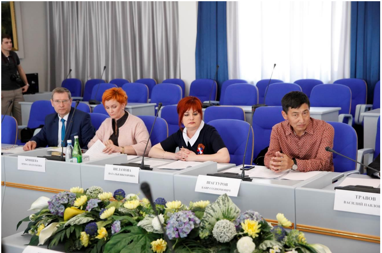
Участники круглого стола

Участниками круглого стола отмечены следующие проблемы при внедрении электронного документооборота: