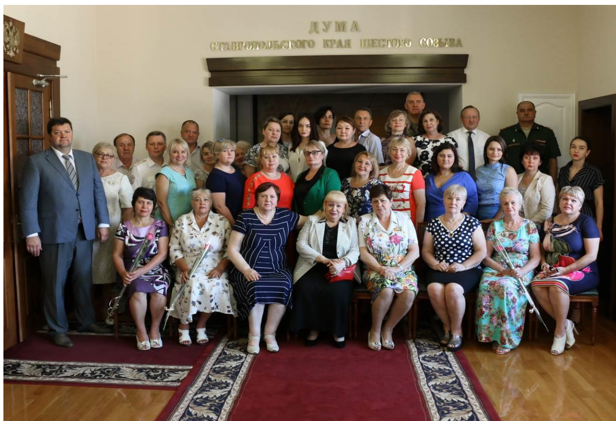
Участники торжественного приема вдов защитников Отечества, погибших при исполнении служебных обязанностей

Все участницы получили памятные подарки.