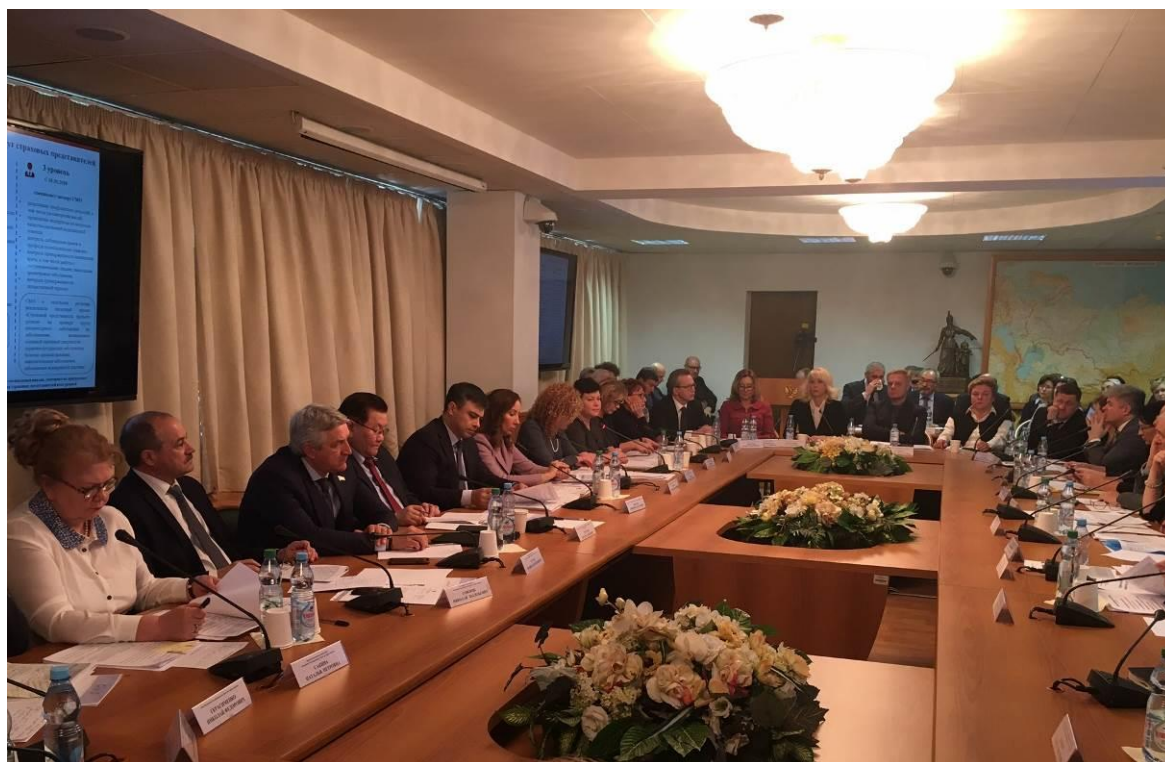
Заседание круглого стола в Государственной Думе Российской Федерации

Участники "круглого стола", с учетом выступлений и дискуссии, а также предложений, поступивших от представителей субъектов Российской Федерации, пришли к единому мнению, что обязанности страховых организаций должны быть более конкретно прописаны в законодательстве.