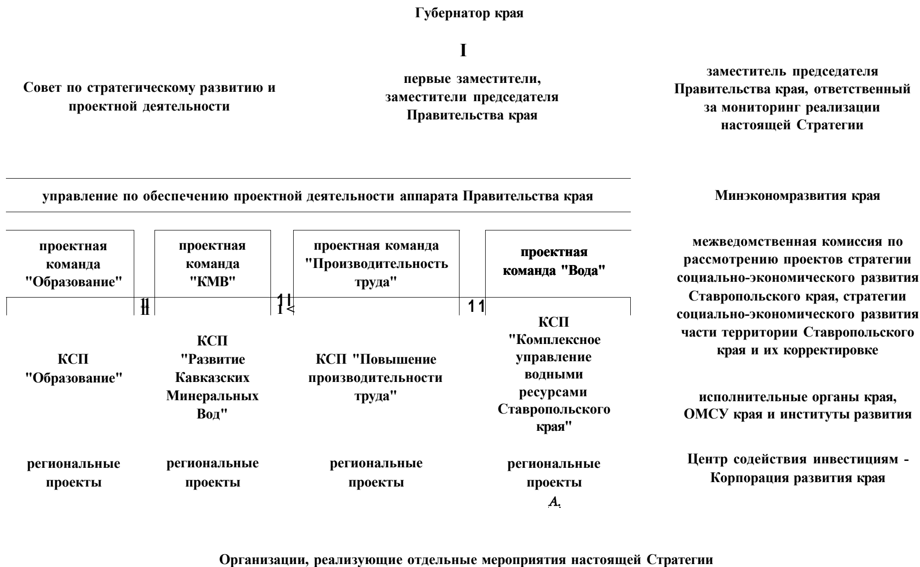
Рис. 3 Общая схема организационной структуры управления реализацией настоящей Стратегии